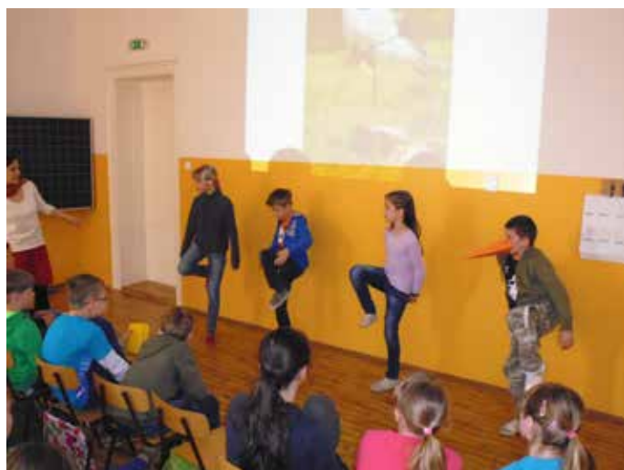
Naše „bociany“ pri oddychu