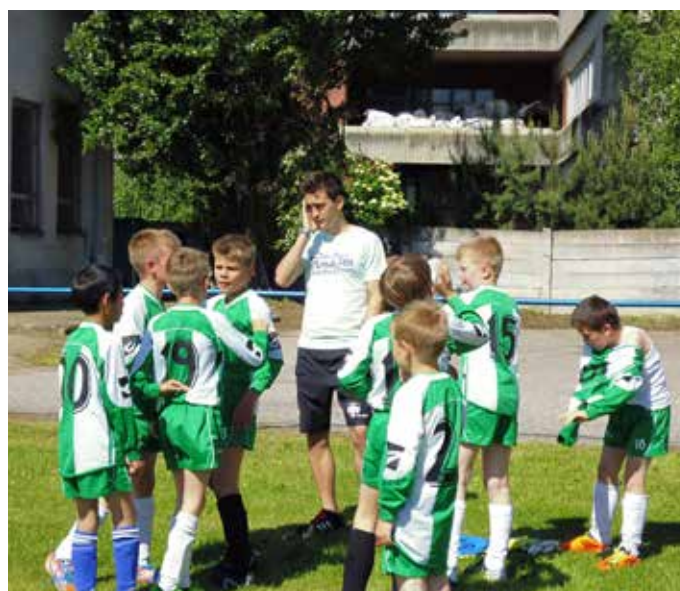
Náš víťazný futbalový team s trénerom