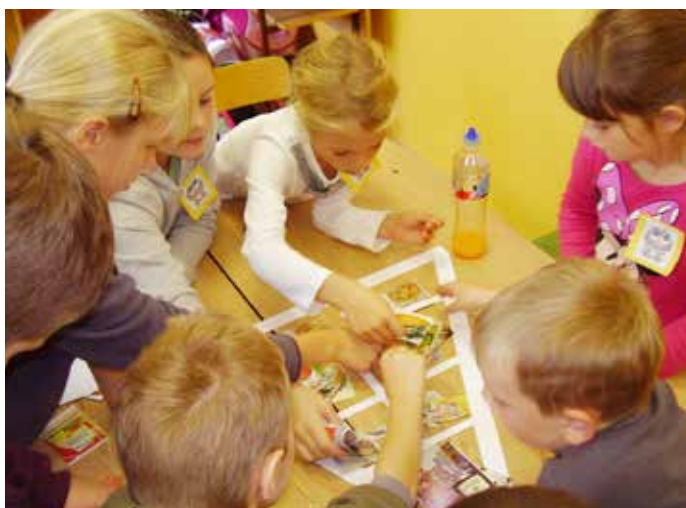
Skladanie potravinovej pyramídy