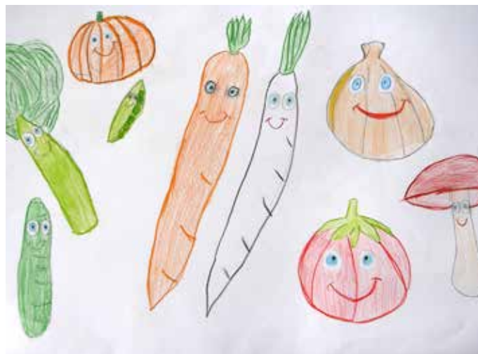
Miriám Tonkovičová, 2. ročník