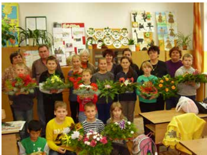
Hodina pracovného vyučovania v spolupráci so staršími rodičmi žiakov