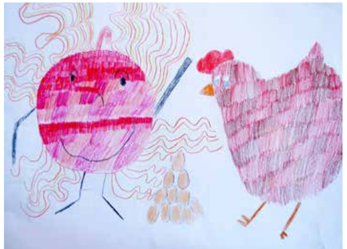
Lea Pálešová, 1. ročník