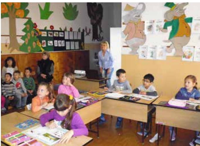
Žiaci prvého ročníka na otvorenej hodine prírodovedy