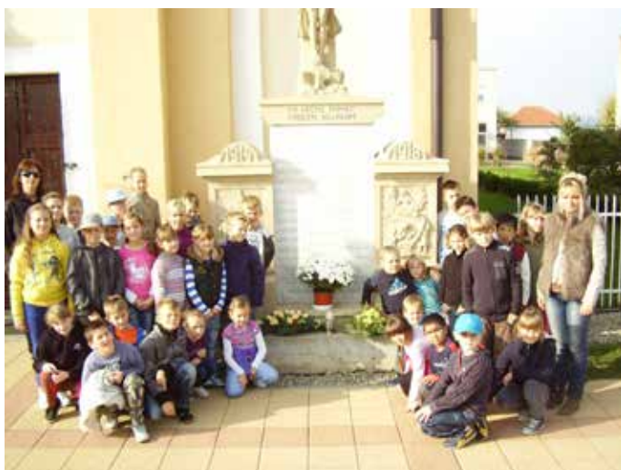
Uctenie pamiatky padlých vojakov v I. svetovej vojne