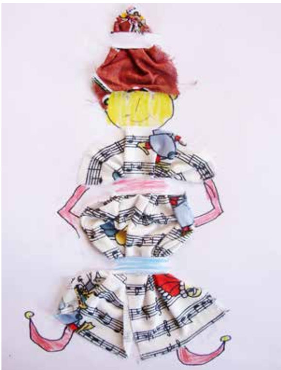
Matúš Malina, 3. ročník