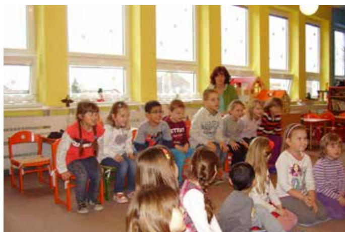
Súčasní prváci na návšteve materskej školy