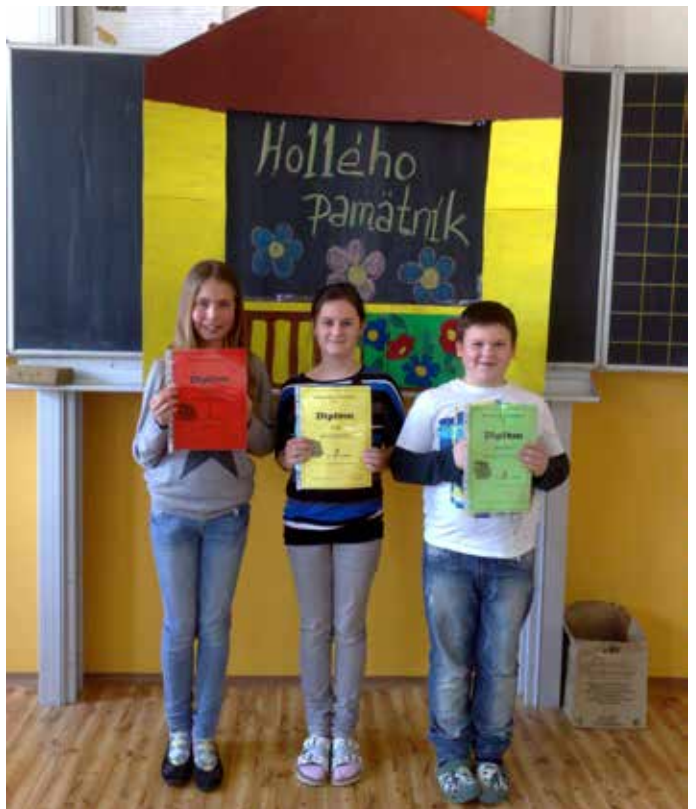
Víťazi kategórie proza v súťaži Hollého pamätník