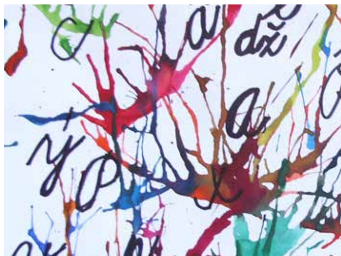
Kristián Škrabák, 1. ročník