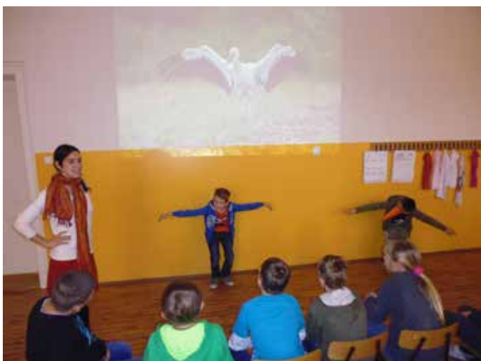
Naši žiaci sa na chvíľu stali lietajúcimi bocianmi.