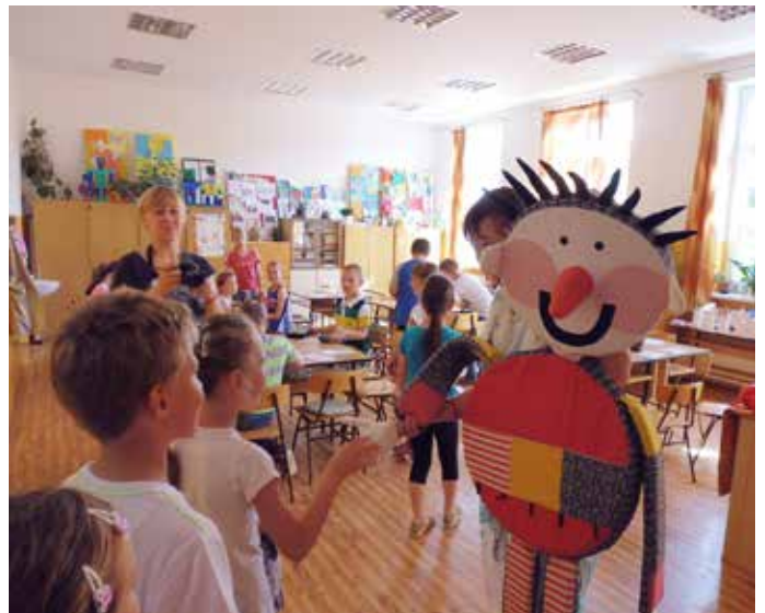
Deti sa predstavujú Osmijankovi