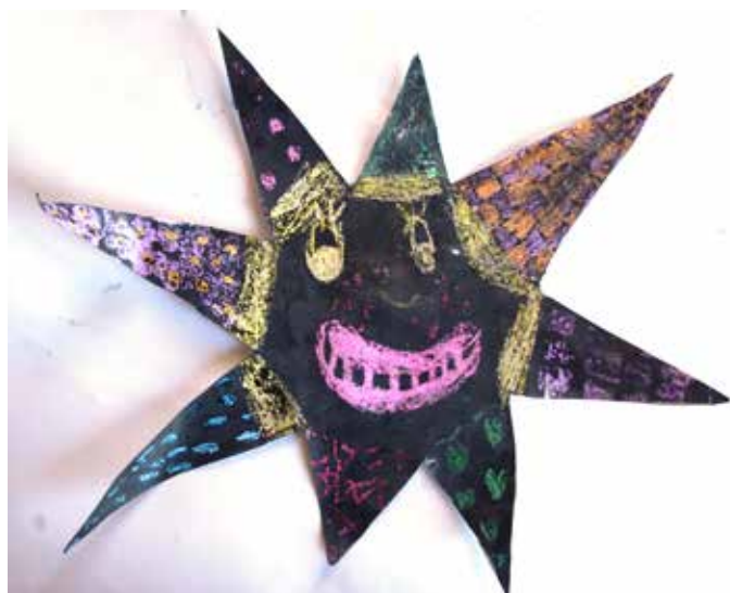
Žaneta Šulíková, 2. ročník