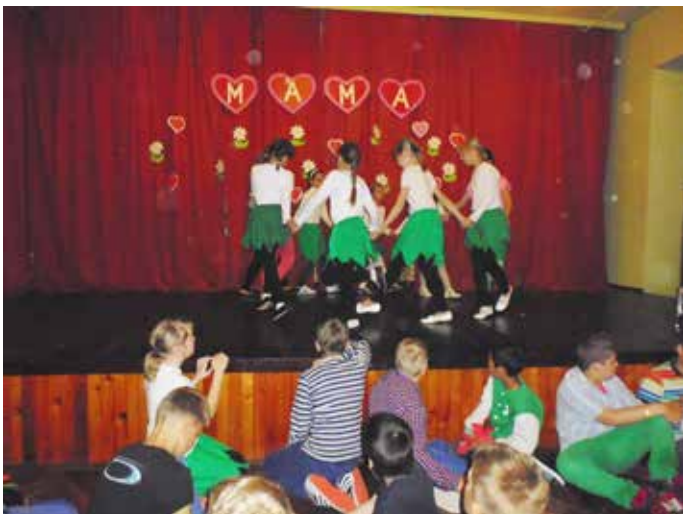
Program našich žiakov ku Dňu matiek

Súčasťou napĺňania cieľov zdravého životného štýlu bolo tiež absolvovanie zubnej prehliadky.