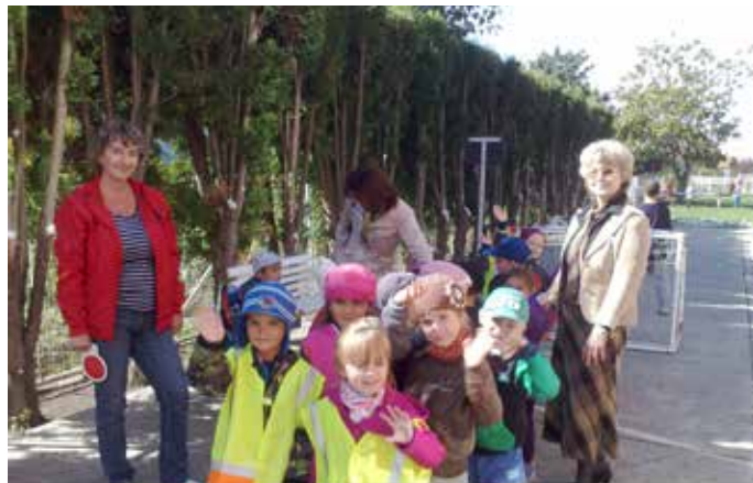
Deti z materskej školy na návšteve našej školy