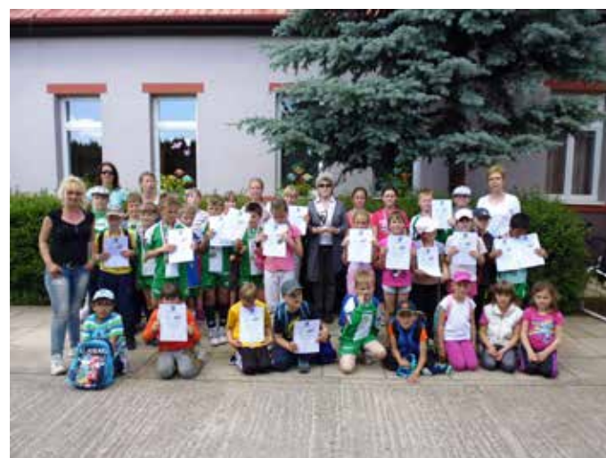
Naša škola po získaní prvého miesta