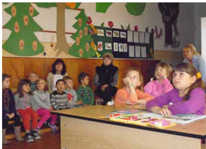
Žiaci materskej školy pri sledovaní otvorenej hodiny