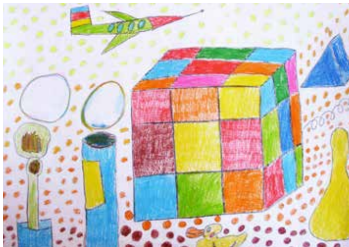
Matej Hornák, 2. ročník