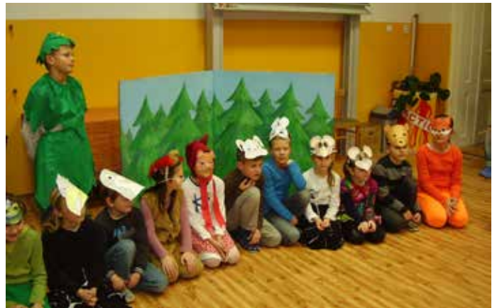
Vianočná besiedka pre rodičov