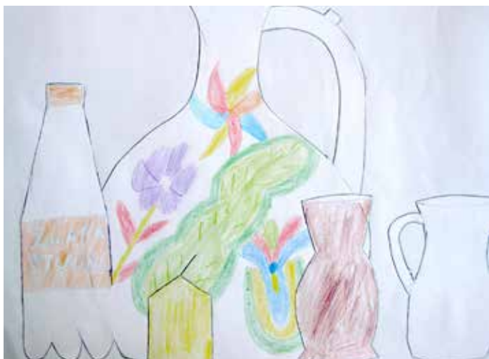
Patrik Palkech, 4. ročník