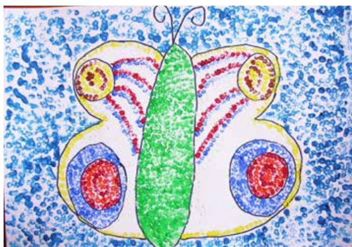
Sára Belanová, 4. ročník

V hlavnej časti motivovala p. uč. žiakov rozprávkou o nespokojnom kuriatku. Týmto príbehom plynule nadviazala na tému vyučovacej hodiny,