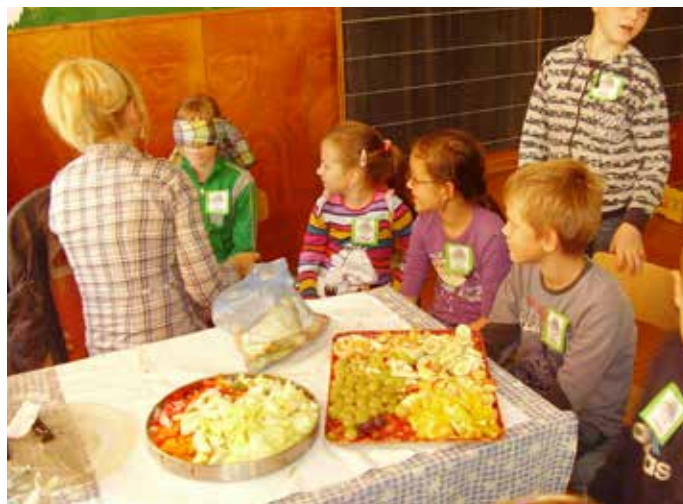
Súťaž v hádaní ovocia a zeleniny podľa chuti