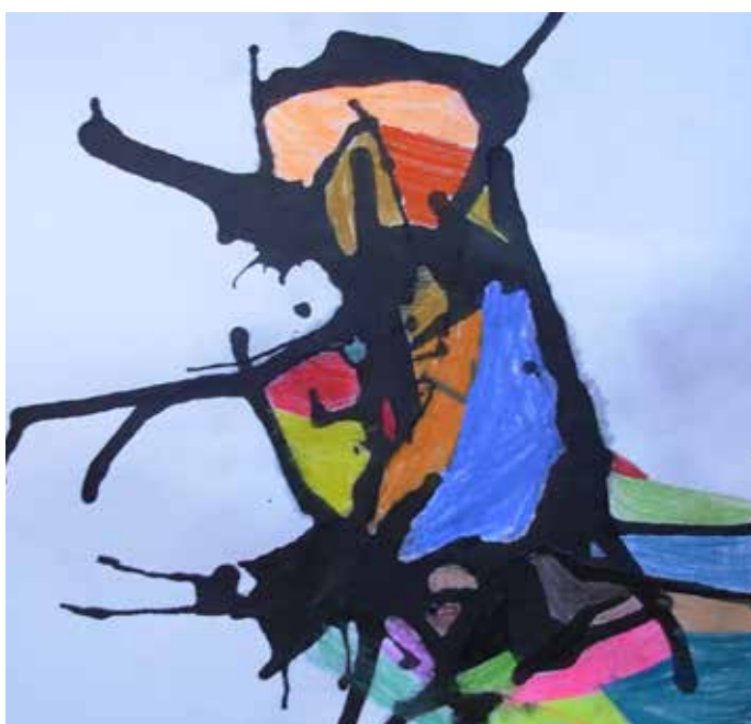
Nela Mešterová, 2. ročník