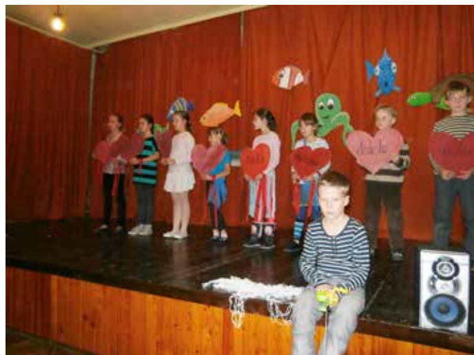
Vystúpenie našich žiakov pri príležitosti Mesiaca úcty k starším