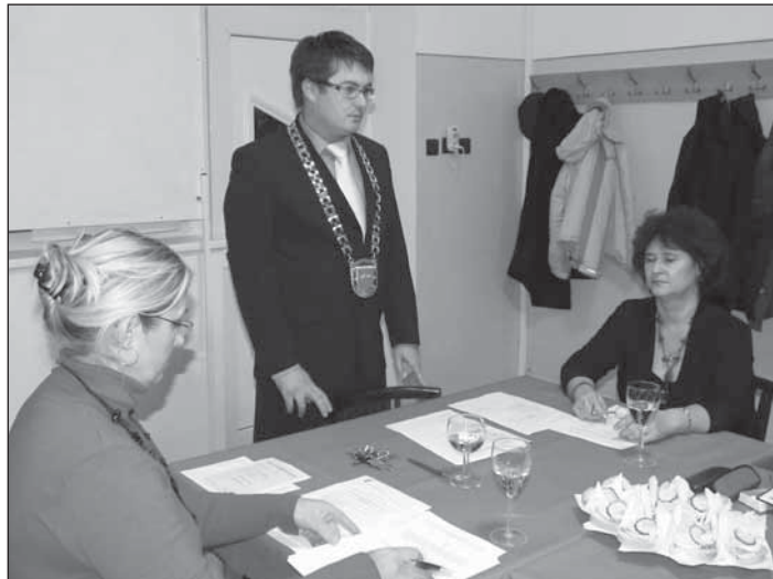
● Ustanovujúce zasadnutie novozvoleného obecného zastupiteľstva.

Obec v zmysle zákona č. 7/2010 Z. z. o ochrane pred povodňami vypracovala VZN, ktorým sa vydáva Povodňový plán záchranných prác. Uvedený dokument po schválení poslancami bol predložený Obvodnému úradu životného prostredia v Piešťanoch.