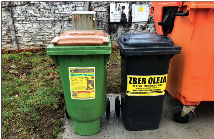
• V obci je zavedený zber biologicky rozložiteľného kuchynského odpadu – zelená alebo hnedá nádoba je na zberných hniezdach