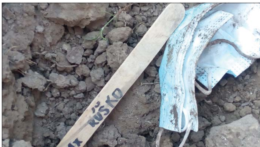
● Cintorín odpadkov – rúško po mesiaci v zemi