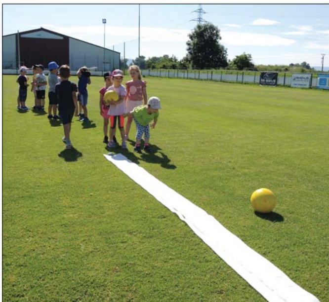
● Do hodu loptou dali deti všetku svoju silu