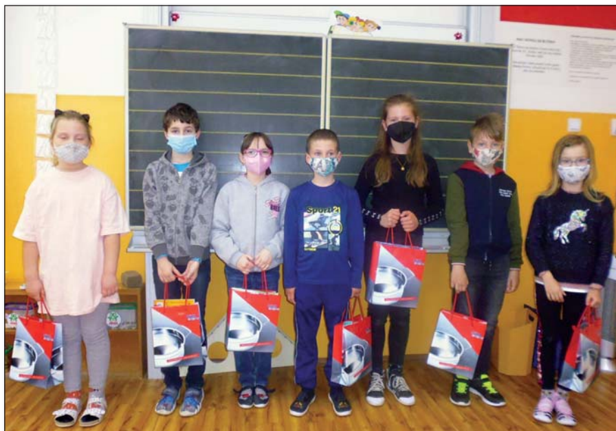
● Úspešní riešitelia súťaže Knižná šifra

Keďže sa nemohli organizovať ani podujatia, boli sme odkázaní na ponuku internetových aktivít, do ktorých sme sa aj zapojili podľa možností. Na jeseň to bola tradičná súťaž iBodor, kde žiaci 3. a 4. ročníka preu-