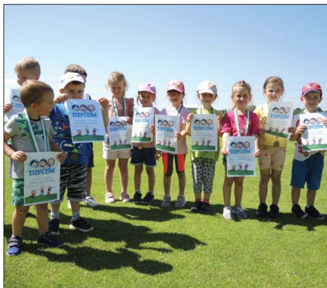
● K medaile patrí aj pochvalný diplom, pamiatka na škôlkarskú olympiádu