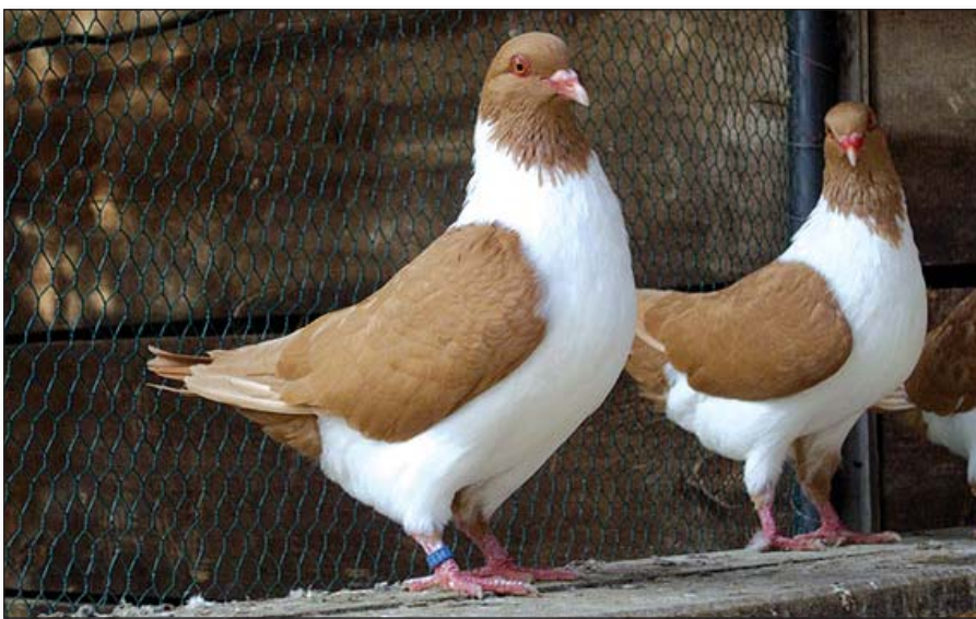
● Chov holubov je vraj vášňou na celý život

Chovatelia sa naďalej venovali svojej činnosti, výmenu a kúpu chovného materiálu sprostredkovali cez internet, nakoľko sa neorganizovali ani oblasťné výstavy. V roku 2020 sa počet aktívnych členov nezmenil. Ako