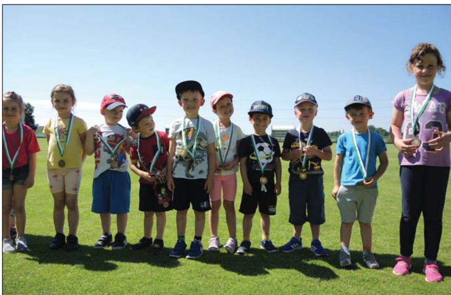
● Za snaživý športový výkon si medailu zaslúžili všetky deti

S postupným uvoľňovaním zákazov a obmedzení sme začali aj my pripravovať pre deti aspoň časť z toho, čo bolo pre škôlku bežnou vecou. Velikánsku radosť deťom urobil Deň Zeme s mnohými zaujímavými aktivitami. Prvým naším malinkým výjazdom po dlhých mesiacoch bola návšteva Agro-družstva v našej obci. Ešte nikdy nám neboli také vzácne teliatka, kravičky či traktory, ako tentokrát. Deti sa nesmieme tešiť z pripravených úloh a stanovišť na dvore materskej školy počas Dňa detí , s nadšením hľadali po dedine cestu k pokladu , vyznačenú farebnými stuhami, s veľkou chuťou si zašportovali na futbalovom štadióne počas našej malej športovej olympiády . Keď k nám po takmer dvoch rokoch zavítalo divadlo NAtRaKY a zahrali nám predstavenie Ako namaľovať dúhu , zhlboka sme sa nadýchli a povedali si, že snád „konečne dobre bude“. Do konca školského roka sme potom stihli ešte jedno divadielko – Kozliatka a tradičnú rozlúčku predškolákov , pri ktorej boli na dvore škôlky prítomní aj ich rodičia.