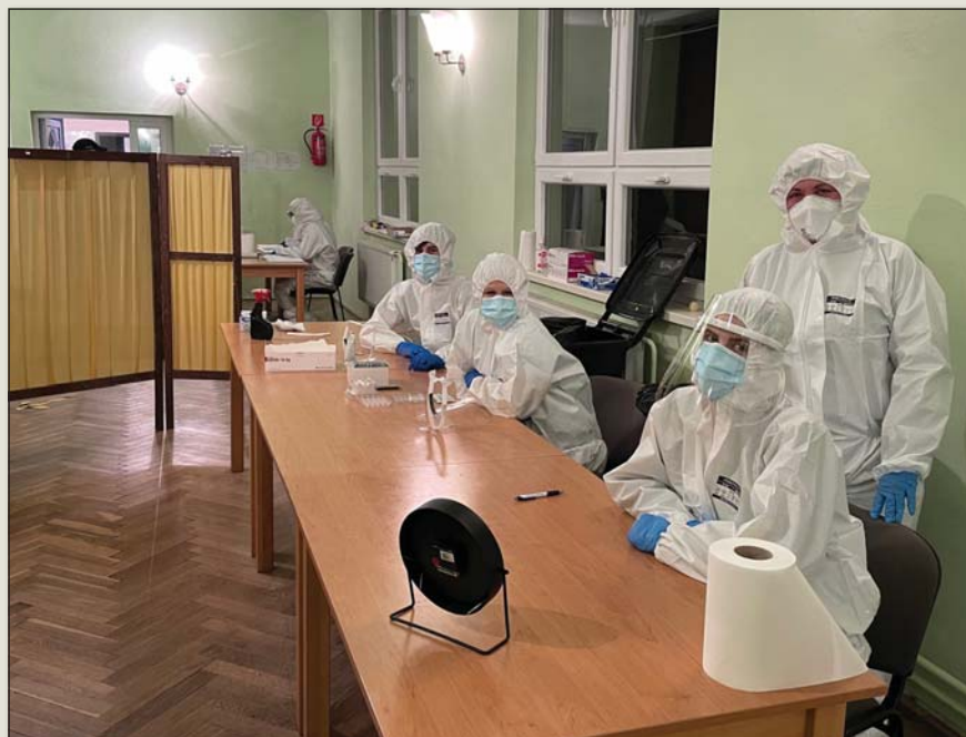
● Za rúškami sa počas testovania ukrývali mnohí mladí ľudia z našej obce – všetkým im patrí poďakovanie nás ostatných

Očkovanie, ktoré bolo určené pre oprávnené osoby a ich sprievod (oprávnená osoba 60+, ZŤP, chronické ochorenie), prebiehalo v dňoch 11.6. a 9.7.2021. Zaočkovaných bolo 47 osôb. Pôvodne bolo prihlásených 75 osôb, ale z dôvodu dlhého čakania sa odhlásili a zabezpečili si očkovanie po vlastnej línii. - aj -