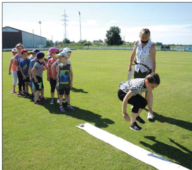
● Skok do diaľky bol jednou z troch športových disciplín a mnohým deťom sa skutočne vydaril

mohli mamičkám predviesť naživo, ale vidieť ho mohli aspoň sprostredkovane, cez videá.