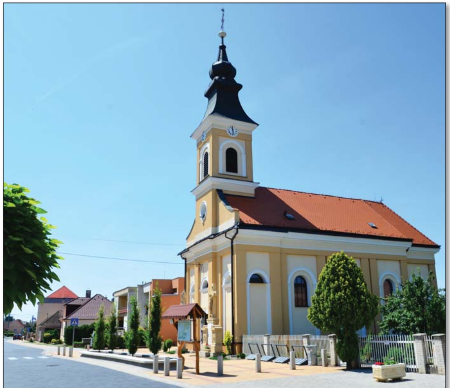
● Kostol sv. Štefana kráľa v Trebaticiach

Nočnú odprosujúcu pobožnosť 18. júna sme prežívali veľmi intenzívne. Veľkolepo vyzdobený kostol a sviatostná atmosféra nám umožnila sústrediť sa na Božské Srdce, stredobod tohto