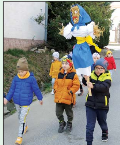
● V čase pandemických obmedzení Morenu do potoka vynášala iba malá skupinka detí

Nakoľko umiestniť všetky fotografie na strany 10 – 12 sa nedalo, využívame priestor a predstavujeme ďalších škôlkarov tu.