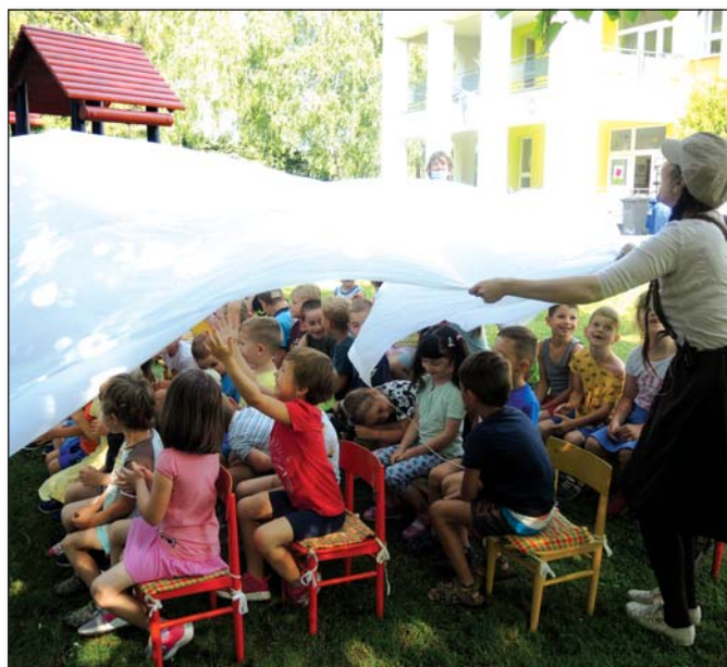
● Práve letíme v oblaku počas divadielka Ako namaľovať dúhu