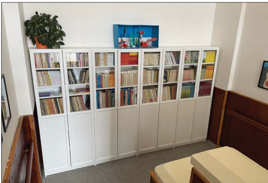
● Nová moderná knižnica

Tým to však neskončilo, objednali sme aj nové skrine do jednej triedy a na chodbu a moderné – výškovo nastaviteľné lavice do všetkých tried, ktoré nám koncom mája dodali a my sme ich s radosťou umiestnili do tried. V kútiku duše sme dúfali, že získame aj podporu nášho projektu Moderejšia škola – výzva ministerstva školstva – a modernizáciu