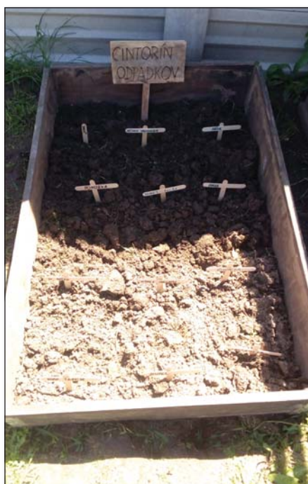
● Prváčikovia založili cintorín odpadkov

Svätojánsky čajík zber: 24.6.2021 zloženie: medovka, levanduľa, mäta, tymián, skorocel, kvety slezu a nevädze