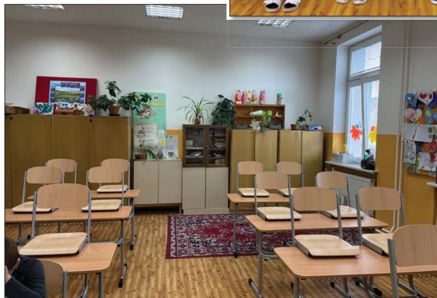
● Nové nastaviteľné lavice v triedach

kázali svoje logické myslenie a viacerí z nich boli úspešnými riešiteľmi. Štvrtáci okrem toho zopakovali aj Test informatického myslenia pod záštitou IT Akadémie, čo prvýkrát absolvovali ešte ako tretiaci. Test porovnával ich posun v oblasti digitálnych zručností a preukázal zlepšenie u väčšiny žiakov.