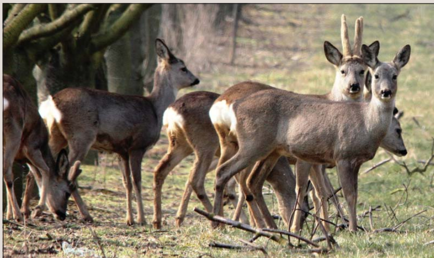
● Premnožená srnčia zver robí značné škody na poliach i vo vinohradoch

Spoločné poľovačky na bažanta sa uskutočnili len tri, poľovačka na zajace bola zrušená z pandemických dôvodov. Povolené však boli individuálne poľovačky, v rámci ktorých bolo ulovených 18 ks srnčej zveri,