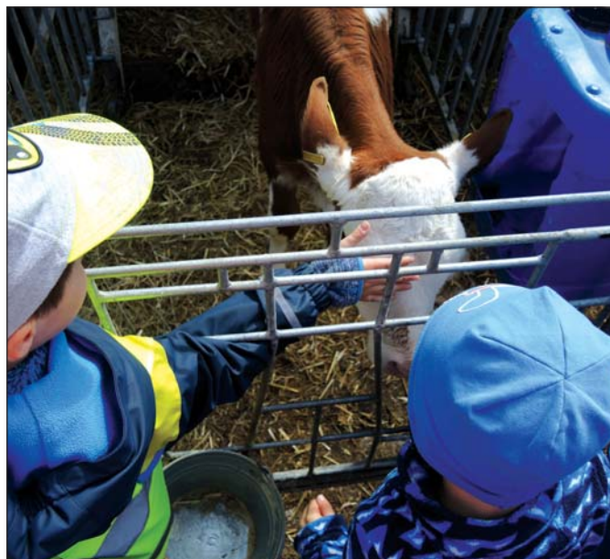
● Teliatok sme sa vôbec nebáli, zato ony nás trošku áno

V mesiaci máj sa uskutočnil zápis detí na školský rok 2021/2022. Podaných bolo 18 žiadostí, prijatých bolo 14 detí, presne toľko, koľko odchádza do základnej školy. Od septembra teda budeme mať v oboch triedach maximálny počet detí – 24 a 20. Deti navštevujúce materskú školu posledný rok pred nástupom do základnej školy a aj ich rodičov čaká veľká zmena. Po prvýkrát bude pre nich predprimárne vzdelávanie povinné . Trvať bude jeden rok, minimálne 4 hodiny denne. Materská škola bude dôsledne kontrolovať dochádzku detí, ospravedlnený bude musieť byť každý deň neprítomnosti dieťaťa. Podrobnosti si rodičia môžu nájsť v oznamoch na webovej stránke materskej školy, tak isto ich dostanú na začiatku školského roka v materskej škole.