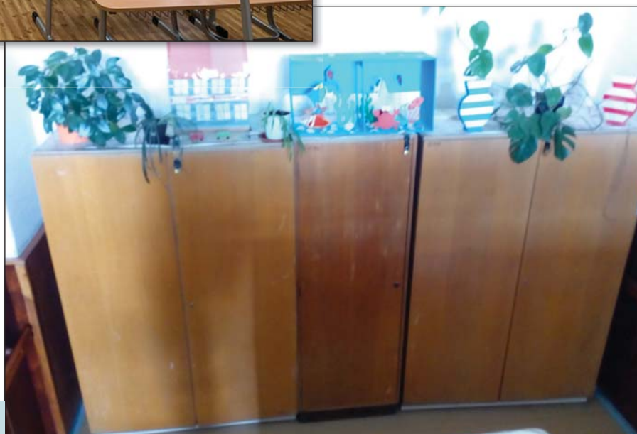
● So starou knižnicou sme sa rozlúčili

Online vyučovanie pokračovalo aj vo februári. Od 8. marca sme obnovili vyučovanie pre žiakov rodičov z kritickej infraštruktúry a pre rodičov, ktorí museli chodiť do práce. Vytvorili sa dve skupiny v škole – vyšší žiaci ostali doma a pani učiteľky tiež vyučovali buď zo školy (aj online), alebo z domu – aj tých, ktorí boli v škole. Žiaci sa pripájali na online hodiny svojej triedy, či už z domu, alebo zo školy. Po veľkonočných prázdninách nastúpili všetci žiaci do školy za prísnych hygienických opatrení a vyučo-