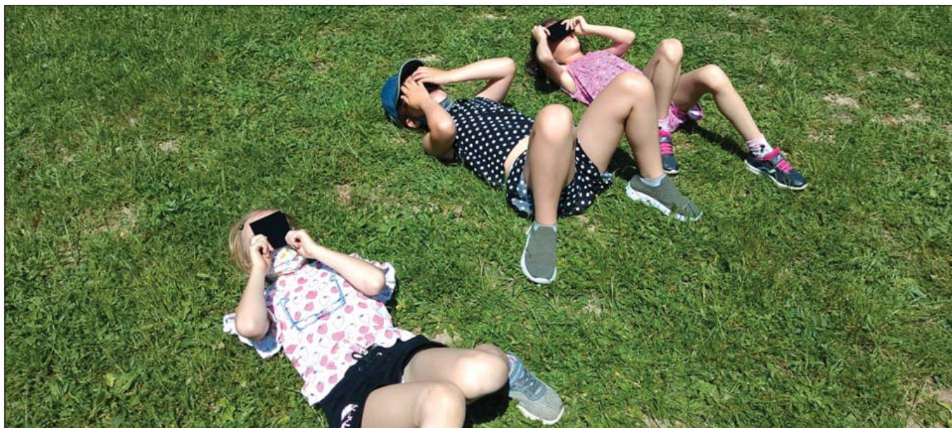
● Pozorovali sme zatmenie Slnka