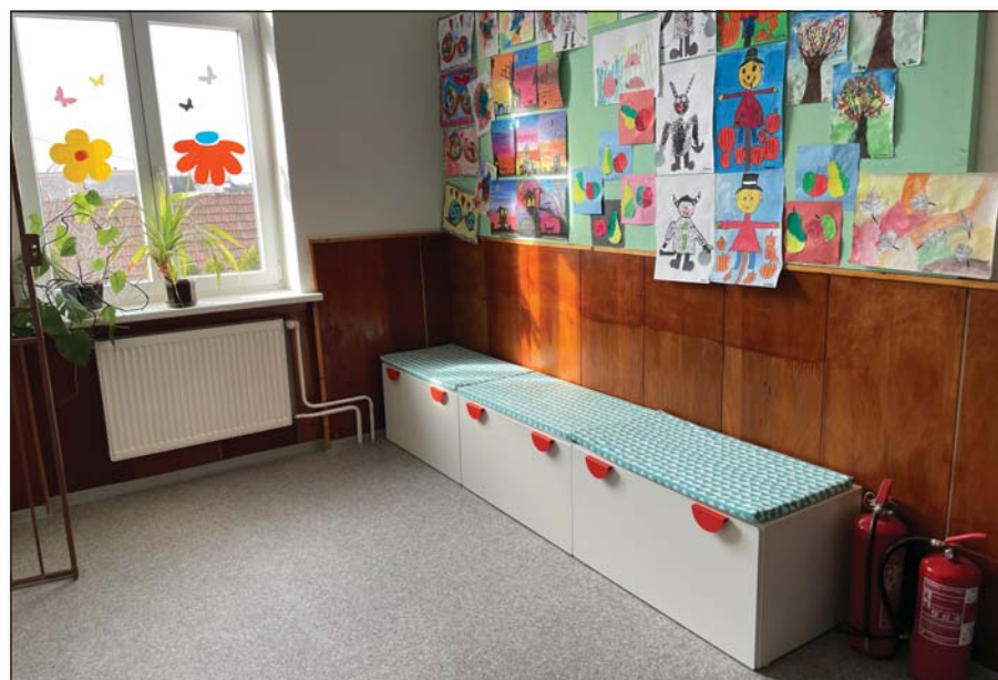
● Čitateľský kútik s pohodlným sedením

priestorov ešte rozšírime o netradičné tvary lavíc, relaxačnú zónu a podobne, ale to sa, žiaľ, nepodarilo. Tak sa tešíme z toho, čo sme