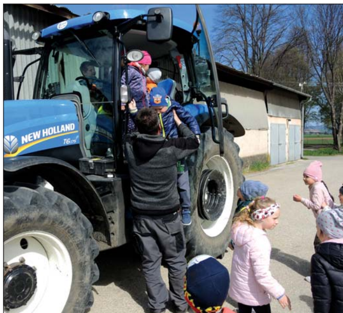
● Tipnite si, koľko detí sa zmestí do traktora