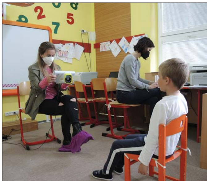
● Takto merali zrak deťom členky Únie nevidiacich a slabozrakých Slovenska