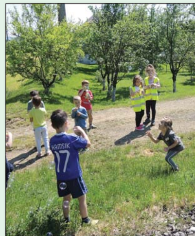
● Hľadaný poklad – bublifuky staršie deti hneď aj vyskúšali