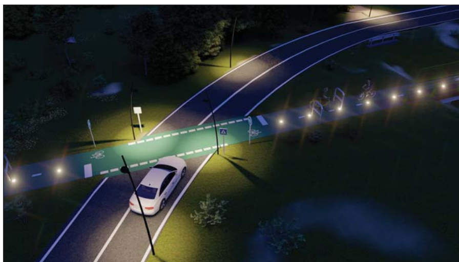
● Vizualizácia technického riešenia cyklotrasy v mieste súčasného železničného priechodu pri Kocurciach

Realizácia tohto investičného zámeru v tomto roku je závislá od úspešnosti žiadosti o dotáciu,