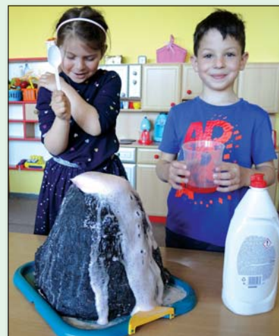
● Pozor! Práve vybuchuje sopka!