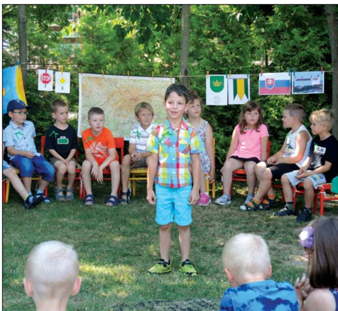
● Držte mi palce, práve odpovedám na maturitnú otázku...