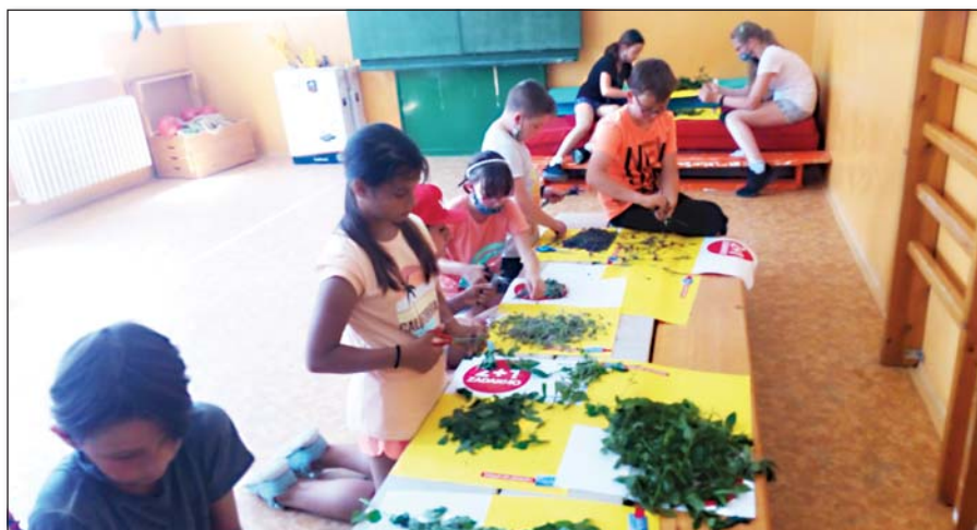
● Spracovanie pozberaných bylínok a naše bylinkové balíčky

ložilo úplne, z papierovej rolky zostalo málo, aj kompostovateľný tanier sa začal postupne strácať... Ale plasty, kovy, textil a aj žuvačka boli také, ako sme ich tam pred mesiacom zakopali. Isto si uvedomujete, že mesiac je krátky čas, no deti sú nedočkavé, a tak sme pred prázdninami pozorovali prvý raz. V septembri budeme pokračovať.