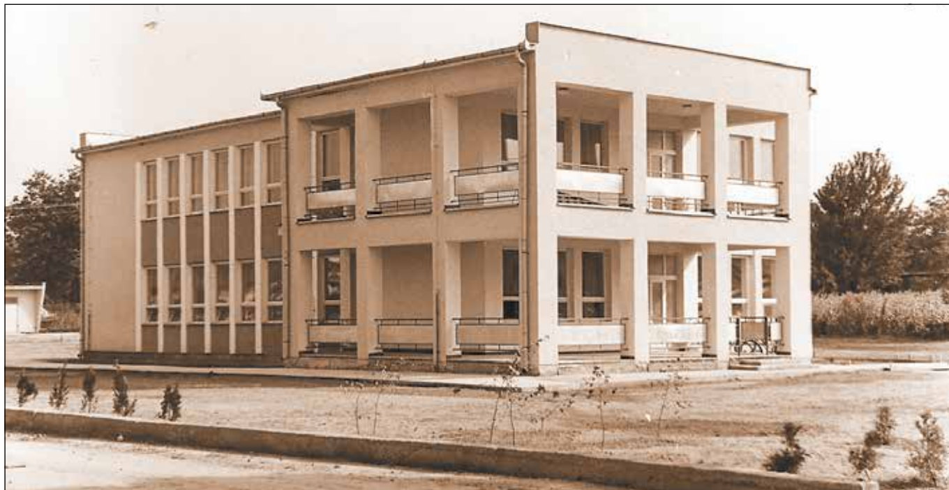
● Budova materskej školy a čerstvo zasadené brezy – dnes už mohutné stromy

Štyridsať rokov je pre človeka snáď najlepši vek. Už má nájdené svoje miesto v živote, vie, kam chce smerovať a čo dosiahnuť. Má zapustené korene a v hlave mnoho cieľov a nápadov. A nechce zostarnúť bez toho, aby po sebe niečo užitočné a trvalé zanechal. Takáto čerstvá štyridsiatnička sa nachádza aj uprostred našej obce. Vie presne, čo chce dosiahnuť, má svoje pevné miesto nielen uprostred zeleného dvora, ale i v srdciach mnohých Trebatičanov a je ňou budova trebatickej materskej školy.