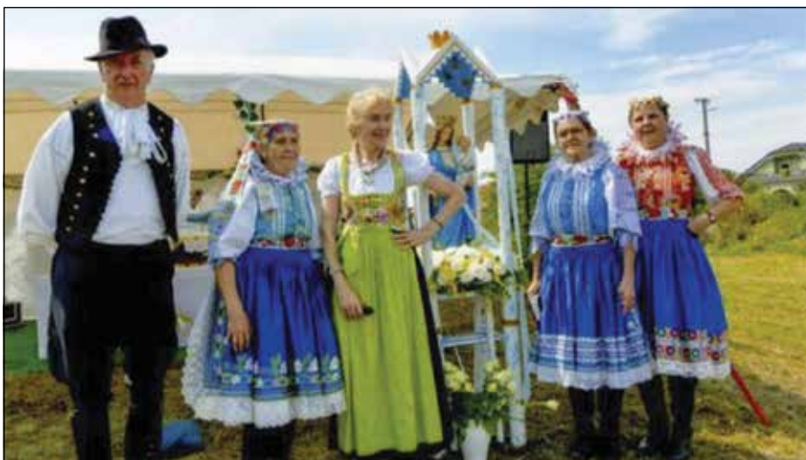
● Členovia ZO JDS počas procesie ku Kaplnke Panny Márie Kráľovnej v Borovciach