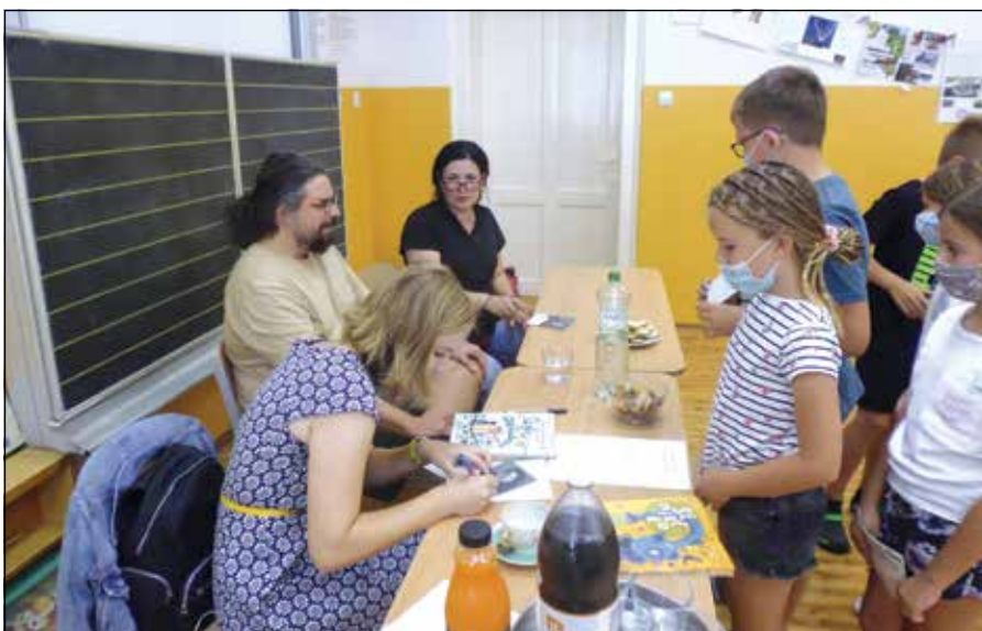
● Cesta z Ošemetna – beseda v prvom turnuse