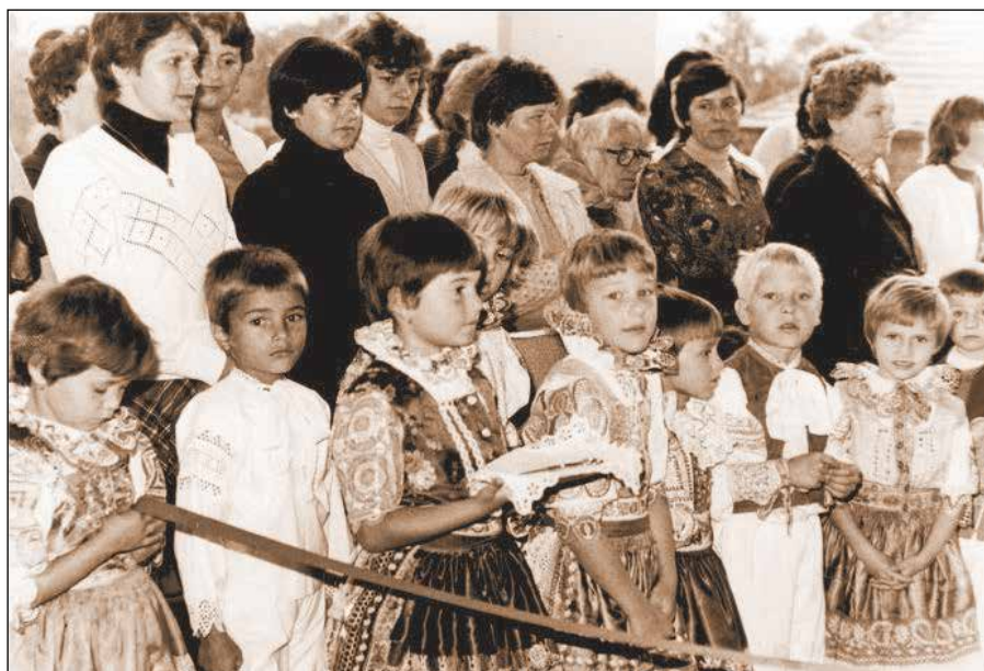
● V roku 1981 škôlkari, dnes zrelí, dospelí ľudia