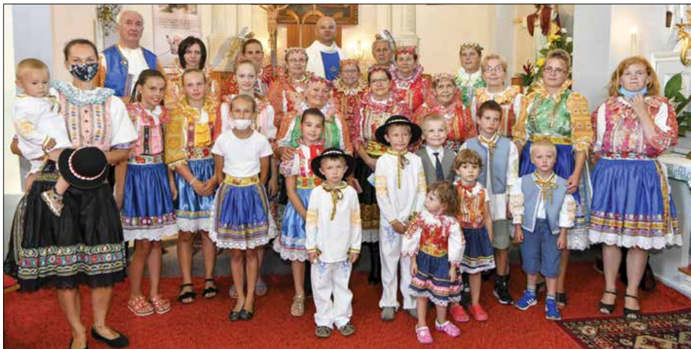
● Krojovaní účastníci slávnostnej nedeľnej svätej omše s poďakovaním za úrodu