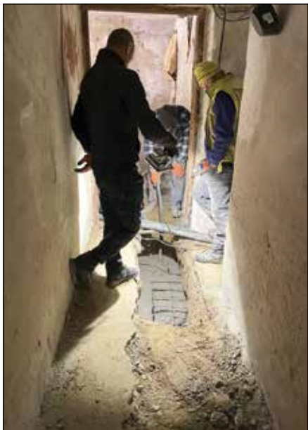
● Prvýkrát sa začal liat' betón pod základy existujúceho objektu domu služieb v polovici novembra

Je daný predpoklad, že práce budú ukončené až na jar budúceho roka.