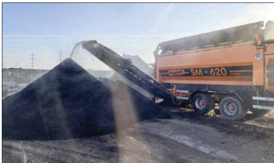
● Výsledný produkt – kompost si mohli v tomto roku prevziať bezplatne na zbernom mieste i obyvatelia Trebatíc

Zámerom obce je od termínu zberu nádob na BRO zavedenie evidenčného systému, ktorý bude pozostávať z inštalácie RFID čipov, ktoré budú v súčinnosti s vážiacim zariadením nainštalovaným na zberovom vozidle a softwarom evidovať a vyhodnocovať zber každej nádoby. Na tento systém evidencie by mala v bu-