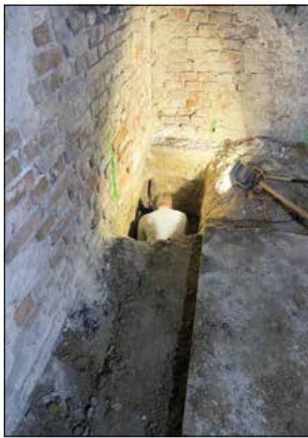
● Rekonštrukcia domu služieb sa začala náročnými prácami na zosilnení existujúcich základov pod dozorom statika