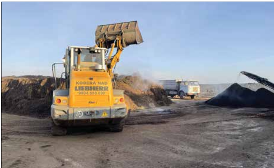
● Spracovanie biologicky rozložiteľného odpadu zo záhrad v kompostárni v Krakovanoch

Zámerom Obce Trebatice je naplniť zákonné požiadavky a vzhľadom na to obecné zastupiteľstvo (ďalej len „OZ“) na svojom novembrovom