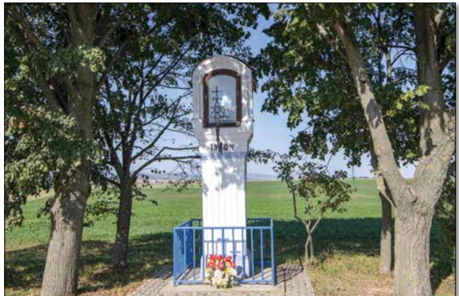
• Kaplnku majstri ochotne a nezištne prebudili k novému životu

Teraz, keď príroda odpočíva a polia sú pusté, určite nás potešia zábery na obno-