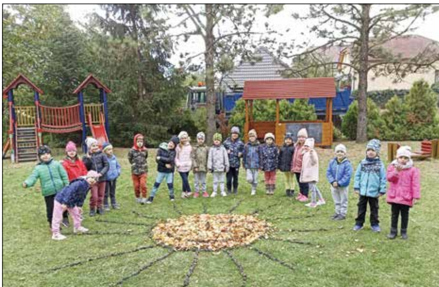
● Naše slniečko presvietilo aj oblaky

Takto na jeseň sa s deťmi zvykneme učiť nielen o zelenine a ovocí, ale i o plodinách na poli. A keďže platí, že stokrát lepšie niečo zažiť, ako len počuť, učiteľky deťom oboch tried pripravili zážitkové učenie, počas ktorého deti mladšej triedy asistovali pri pečení chlebiča, deti staršej triedy takmer samy upiekli makový koláčik. Pochutnali si všetci spoločne na oboch, len sa tak zaprášilo.