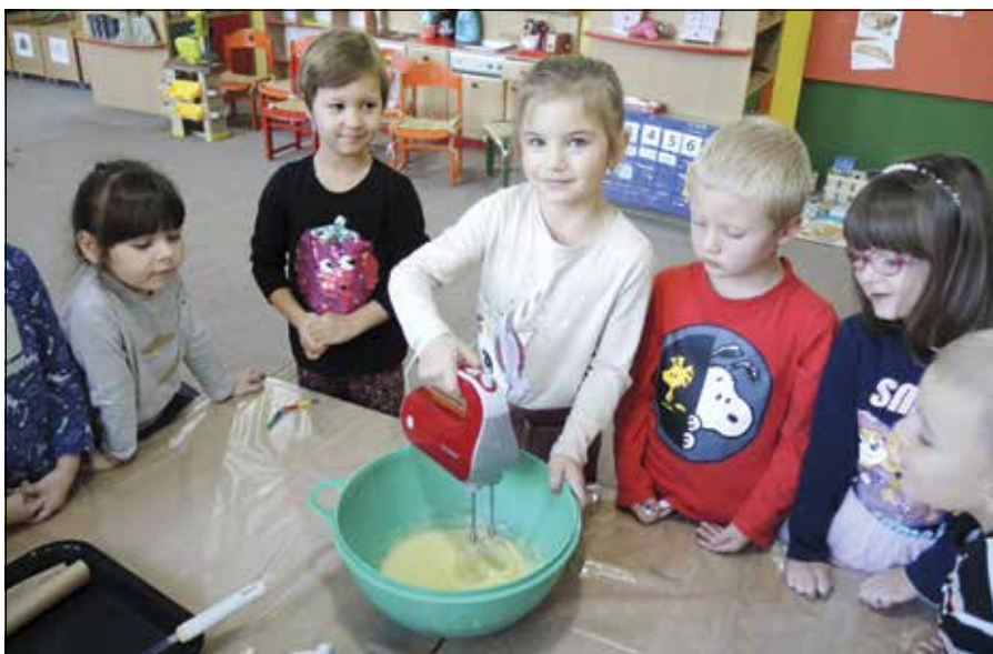
● Mami, nabudúce pečiem doma ja