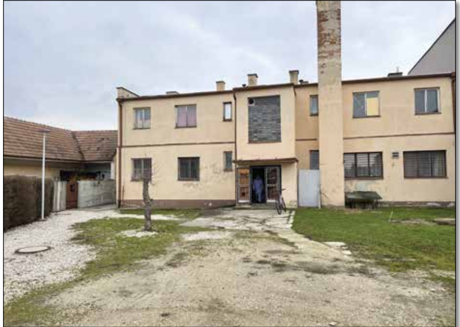
● Pohľad na dom služieb zo Štúrovej ulice pred rekonštrukciou

Dlho očakávaná investičná akcia obce sa v tomto roku už posunula do samotnej realizácie hlavného objektu. V minulých rokoch boli zrealizované stavebné objekty, na ktoré obec dostala dotáciu, resp. financovala ich ZSD, a. s., a to SO 07 – Dažďová kanalizácia a SO 09 – Verejný elektrický rozvod, čím sa k objektu domu služieb priviedla potrebná kapacita NN vedenia. V prvej polovici roka prebehlo verejné obstarávanie na zhotoviteľa stavby, na základe ktorého bola v máji uzatvorená zmluva s najúspešnejším uchádzačom – KANGO, spol. s r. o. V priebehu roka obec získala na bytovú časť polyfunkčného domu dotáciu z MDaV SR vo výške 244 910 € a úver zo ŠFRB vo výške 373 450 €. Stavenisko bolo zhotoviteľovi odovzdané 11. novembra. Termín dokončenia stavby je v zmysle zmluvy o dielo stanovený na 20 mesiacov, čiže do júna 2023. Vyvolané bolo rokovanie so Slovenskou poštou a na rokovaní dňa 23. novembra