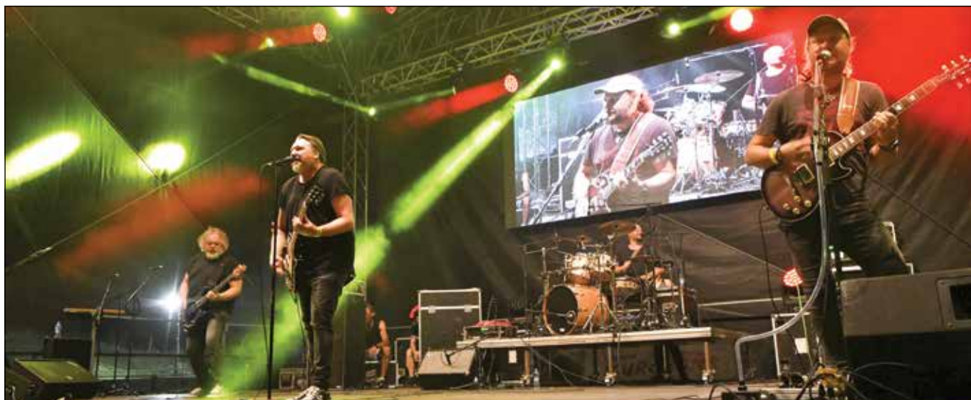
● O správne vyvrcholenie sobotňajšieho večera sa pričínila aj skupina Gladiátor