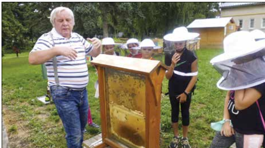
● Žiaci sa približovali k úľom v ochrannom odevu

Nakukli sme aj do apidomčeka a dozvedeli sme sa o apiterapii, ktorá je v súčasnosti veľmi aktuálna. Dokonca sme sa dozvedeli o včelej vode a jej účinkoch. V učebni sme si mohli zopakovať informácie prostredníctvom prezentácie. Deťom sa určite po množstve informácií páčila aj rozprávka o včielkach. Skúsenejší včelár deti aj vyskúšal prostredníctvom testu, za ktorý mohli žiaci získať voskovú včeliu odmenu. Takisto nám pri skúmaní anatómie včely pomohol krásny a ná-