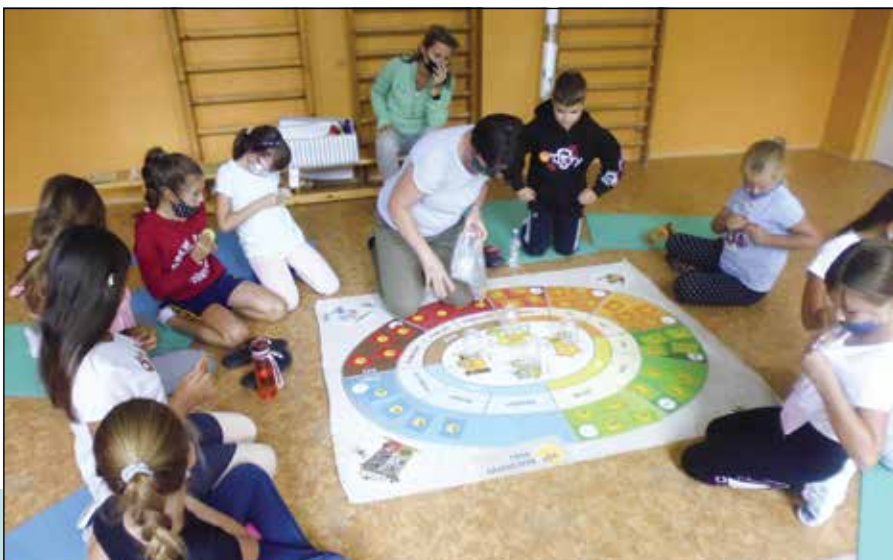
● Spoločenská hra o včelách v treťom turnuse