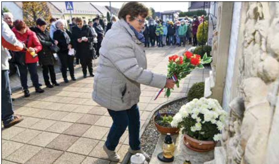
● Prejav úcty a vďaky vojnovým veteránom

Programy, ktoré sme mali navrhnuté v prvom polroku, sme pre pandémiu nerealizovali. Na schôdzi sme zablahoželali jubilantom, navštívili sme aj dlhodobo chorých členov. V letných mesiacoch sme sa išli zrelaxovať na kúpalisko Vinčov les. Slniečko nám hrialo, vodička bola príjemná a hneď sme tam prišli na iné myšlienky.