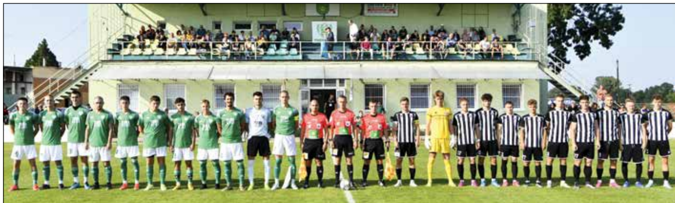
● Víťazstvo v Slovnafcup-e proti FC Petržalka zarezonovalo vo futbale svete

Konečne sme sa dočkali a po dvoch rokoch sme odohrali kompletnú jesennú časť bez prerušenia. Jeseň dvoch súťaží. Prvú polovicu súťažného ročníka poznačil fakt, že sme pôsobili v dvoch súťažiach a odohrali v rozmedzí necelých štyroch mesiacov, od konca júla do polovice novembra, 21 súťažných kôl. Bezmála toľko, čo za predchádzajúce dva súťažné ročníky prerušené pandémieou.