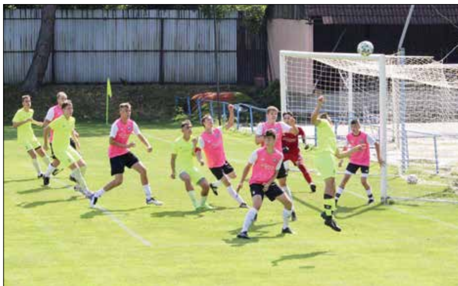
• Zápas U19 MFK Skalica – CFM JA našim chlapcom nevyšiel, prehrali 0:5

15. miesto CFM JA U17 15 2 2 11 12:42 8 bodov