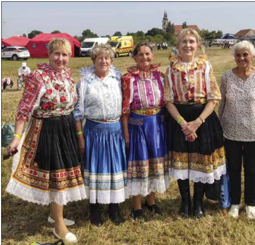
● Aj pútnici z farnosti Borovce si odniesli zo Šaštína požehnanie Svätého Otca