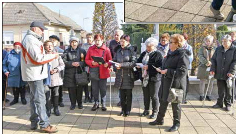
● Na pietnej spomienke pri Kostole sv. Štefana zaspievala aj folklórna skupina Kapustár

Folklórna skupina Kapustár sa zúčastnila na prehliadke seniorských súborov v hudobnom pavilóne Mušľa v Piešťanoch, tiež boli potešíť svojimi piesňami srdcia seniorov v Domove dôchodcov v Moravanoch. Naše členky sa zúčastnili na procesii ku kaplnke Panny Márie Kráľovnej v Borovciach.