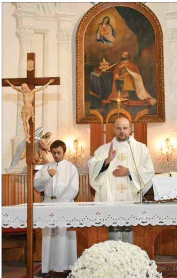
● Podme sa pomodliť...

Láska je vynaliezavá. Je v rukách každého jedného z nás, či budeme vymýšľať, ako šíriť zlo, alebo ako prejavovať dobro. Môžeme sa na druhého zamračiť, alebo sa môžeme usmiať. Môžeme mu pohroziť, alebo zamávať