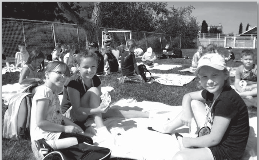
● Po skončení úloh išli všetci na deky hrať sa spoločenské hry