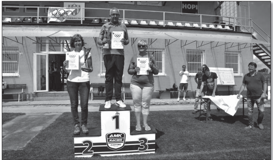
• Vedúci najúspešnejších na stupni víťazov v poradí Dolný Lopašov, Trebatice, Veselé