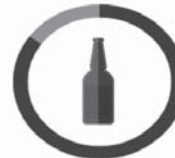
SKLO 4000 ROKOV