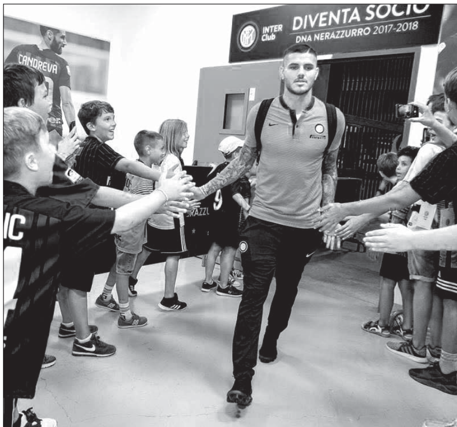
• Domáci hráč Interu Miláno je vítaný mladými nadšencami