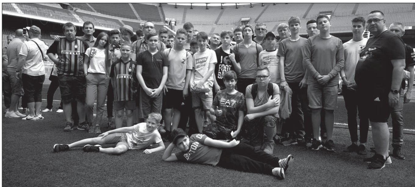
• Na hracej ploche mestského štadióna v Miláne – San Siro