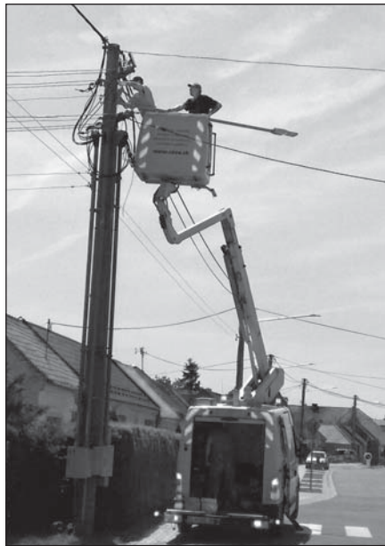
● Rekonštrukčné práce na modernizácii verejného osvetlenia na Hlavnej ulici

Na projekte sa začalo pracovať minulý rok. V roku 2018 prebehlo verejné obstarávanie – najúspešnejší uchádzač ELTODO OSVETLENIE, s. r. o., Košice, Zmluva o dielo uzatvorená 1.3.2018. Od 1.7.2018 je sústava verejného osvetlenia odovzdaná v zmysle Zmluvy o dielo na obdobie 15 rokov do správy spol. ELTODO OSVETLENIE, s. r. o. Pri príprave projektu a nastavení rozpočtu bola vznesená požiadavka zo strany obce, nahradiť existujúce svetelné body novými, úspornými LED svetelnými bodmi a navyše na Hlavnej ulici, pretože ide o najfrekventovanejšiu časť obce, doplniť svetelný bod na každý stĺp. Takisto do projektu bola začlenená výstavba osvetlenia Záhumenskej ulice. V procese spracovania projektu a rozpočtu bolo možné pripomienkovať danú koncepciu. Po ukončení tohto procesu bolo realizované