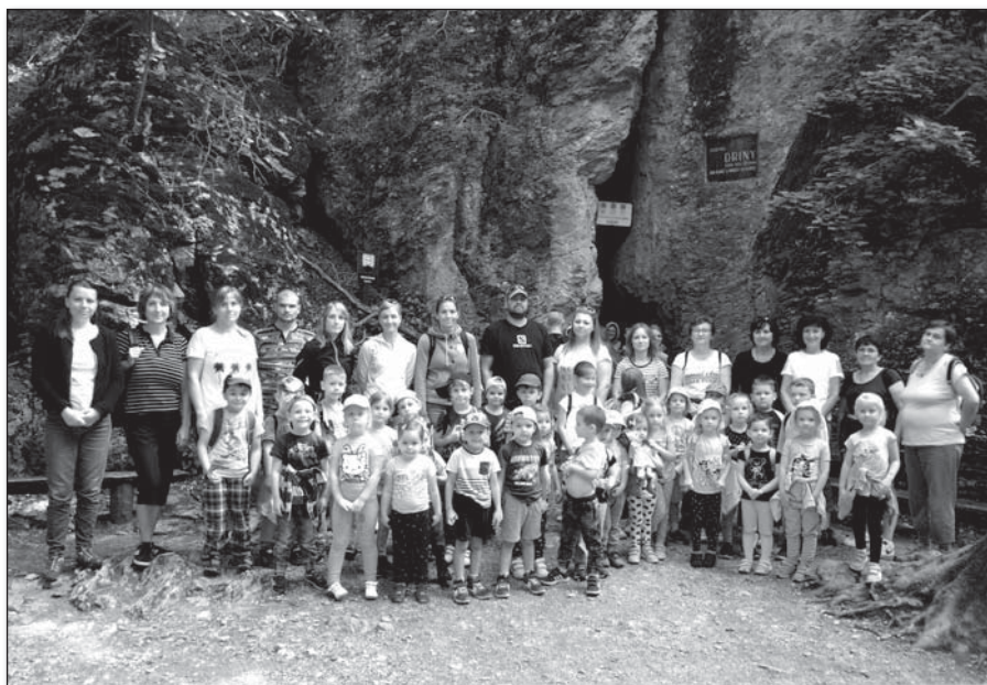
● Na pamiatku fotka pred jaskyňou, ktorú sme zvládli ako veľkí turisti

ším bola návšteva jaskyne Driny, jedinej na západnom Slovensku, a prehliadka nádvorja a okolia Smolenického zámku. V jaskyni deti obdivovali „cencúle, ktoré stále chceli visieť“, slonie uši, zázračné jazierka, skamenenú vílu... Hoci majú naše deti malinké nôžky, zvládli na nich prejsť všetko a ani únavu na nich vidno nebolo. Cestou naspäť predebatovali, dojedli, čo zostalo v batohoch a spokojne odchádzali domov.