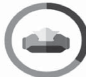
PAPIEROVÁ VRECKOVKA 3 MESIACE