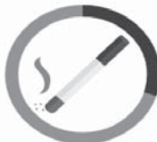
CIGARETA 3 MESIACE - 2 ROKY