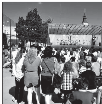
● Areál zdravia bol plný obapolnej lásky