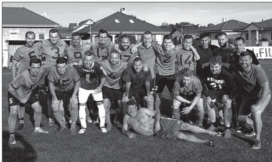
• Pred rozhodujúcim zápasom v Moravskom Svätom Jáne