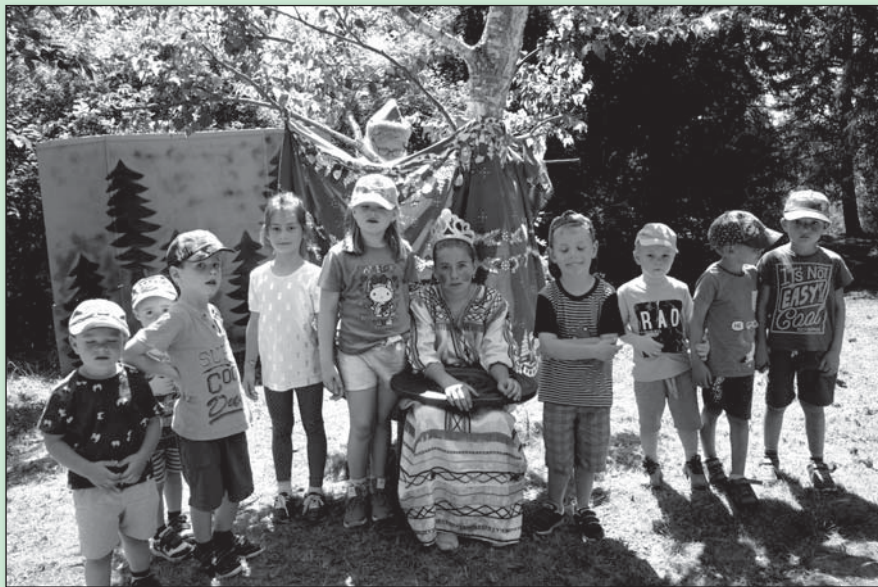
● Nastenku sa nám aspoň trošku podarilo rozveseliť...