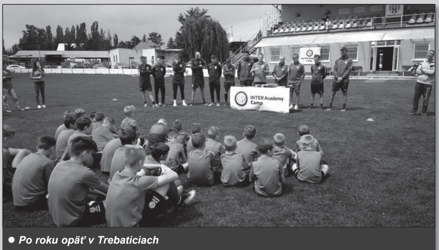
● Po roku opäť v Trebaticiach

- Model kempu a jeho metodológia je daná centrálnou klubom Inter, ale určite sa v každej krajine projekt nastavuje na mieru podľa lokálnych potrieb a špecifik. V našom prípade máme pár zvláštností pre tento rok, napr. v druhom turnuse sa na kempu zúčastnilo aj 11 hráčok slovenského ženského futbalového tímu Special Olympics v rámci prípravy pred odletom na svetový olympiádu Special Olympics Games v Chicagu.