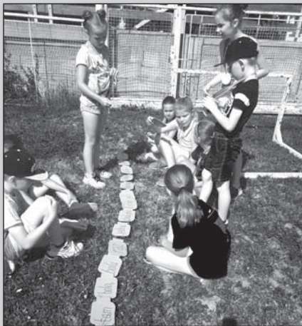
● Skladanie vety z perníkového domčeka