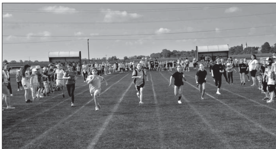
● Prvou disciplínou bol beh na 60 metrov, v ktorom si žiačky z Trebatíc počínali dobre