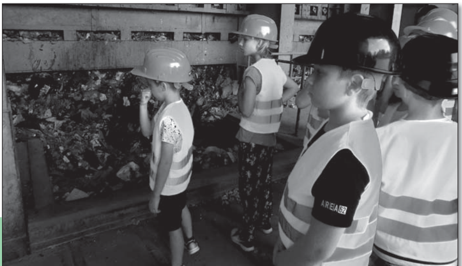
● V priestoroch spaľovne sme videli aj „cítli“ – žeby to zapáchalo? Odpadky boli žerjavom naložené do výšky šiesteho poschodia.

DOMINIK KOVÁČIK, 2. ročník