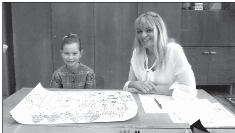
● Od zápisu 5. apríla sa na školu teší aj táto naša budúca prváčka

Ku Dňu Zeme sme zorganizovali v spolupráci s OZ Kvas prednášku a workshop o netopieroch.