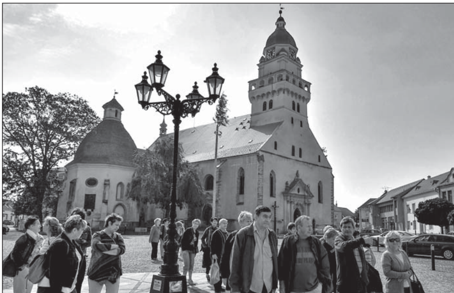
● Na prehliadke okresného mesta Skalica pred Farským kostolom sv. Michala

Folklorná skupina sa zúčastnila na prehliadke seniorských súborov v hudobnom pa-