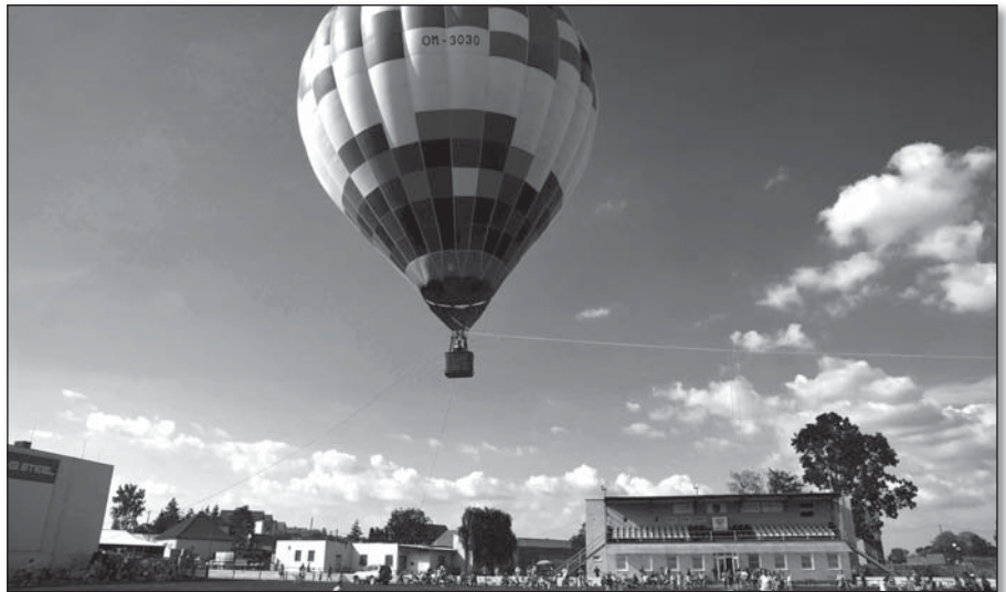
● Na svoj prvý let balónom budú dlho spomínať deti i dospelí

Štadión sa premenil na jedno veľké mravenisko, na ktorom si každý našiel to, čo ho práve zaujalo. Úsmevy na tvárach detí vyčaril tanec krásnych psíkov, s chuťou si zatancovali zumbu, zaskákali na nafukovacom hrade. Keď sa nad plochou trávniku začal dvíhať obrovský balón, deti už nič neudržalo a hoci niektorí so strachom, predsa len si vyskúšali let v prútenom koši zavesenom pod balónom. I mnohí dospelí potvrdili, že to bol pre nich netradičný zážitok. Chvilú po prvých letoch balóna na tréningovom ihrisku