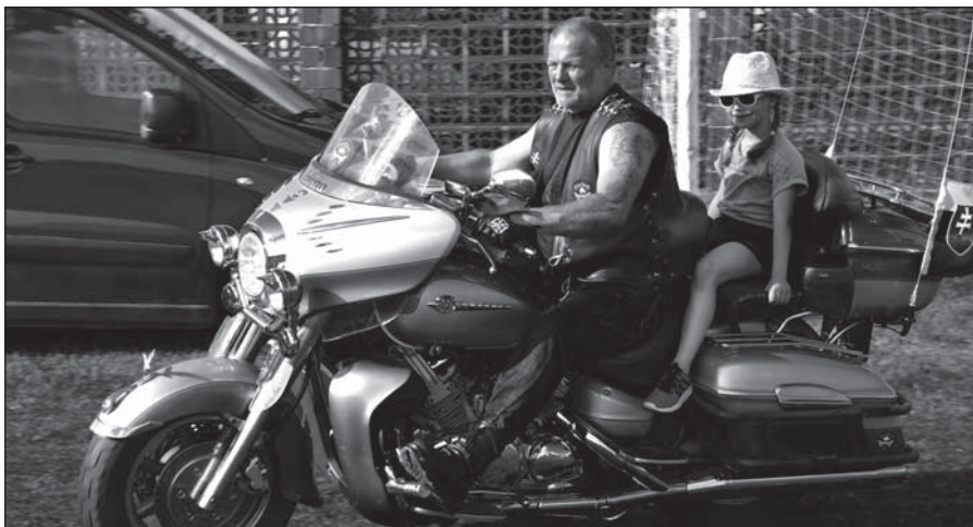
• Motorkári boli úžasní a obdivuhodne trpezliví

Srdečne ďakujeme za všetky deti z našej materskej školy!