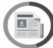
NOVINY 3 - 12 MESIACOV