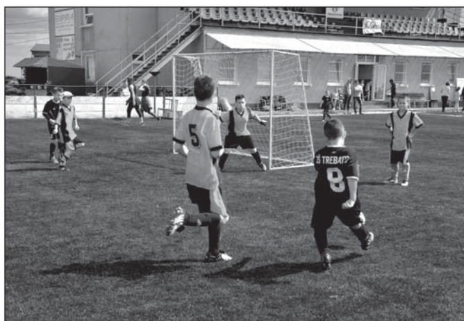
● Mladí futbalisti z Trebatíc sa umiestnili štvrtí