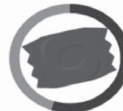
ŽUVAČKA 5 ROKOV