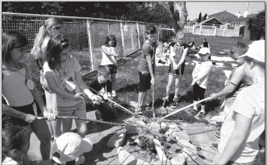
● A takto sme opekali