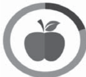
OHRYZOK JABLKA NIEKOLKO TÝŽDŇOV