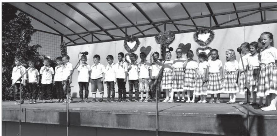
● Starších škôlkarov bolo počuť dod'aleka