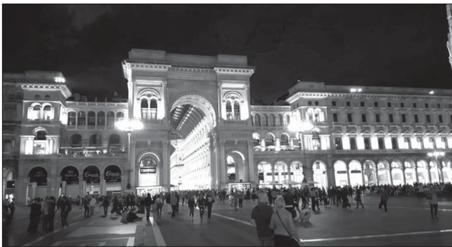
• Námestie Piazza Duomo pred Galériou Vittorio Emanuele II.

Rozhodnutie tentokrát padlo na Taliansko, a nielen futbalom preslávenú metropolu Lombardie – Miláno. Táto myšlienka rezonovala už dlhšie medzi členmi výkonného výboru CFM JA, od prvého stretnutia a návštevy zástupcov klubu FC Internazionale Miláno v Trebaticiach v roku 2017 počas kontrolnej návštevy pred letným kempom. Vďaka spolu-