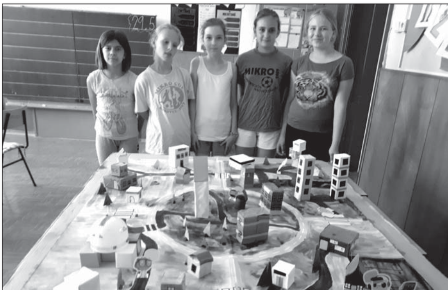
● Ukončením projektu Malá finančná akadémia s Kozmixom bola prezentácia stavby mesta Trebastav žiačok 4. triedy

Žiaci 1. ročníka navštívili Mestskú knižnicu v Piešťanoch , vypožičali si knižky a odvtedy pravidelne každý mesiac chodia na výmenu kníh.