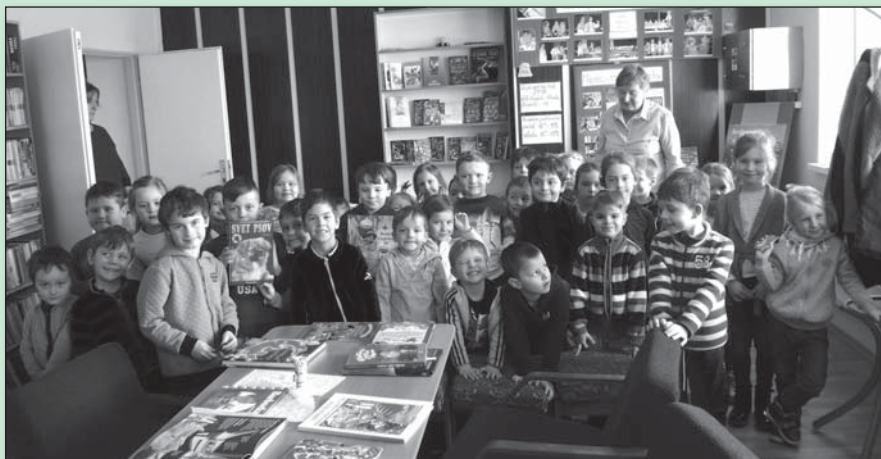
• Hoci ešte nevieme čítať, s knihami sa kamarátíme