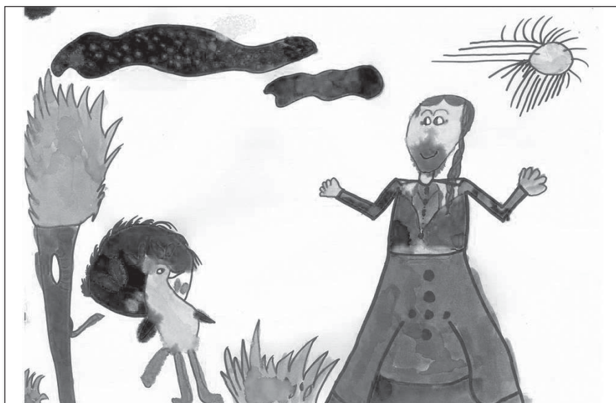
• Ilustrácia piesne Páslo dievča pávy získala 3. miesto

Základná škola Krakovany v spolupráci s Obecným úradom Krakovany pri príležitosti 52. výročia folklórnych slávností a XII. Župného folklórneho festivalu kultúry 2018 vyhlásila aj v školskom roku 2017/2018 pre deti materských škôl a žiakov 1. – 4. ročníka základných škôl výtvarnú súťaž Ľudová pieseň .