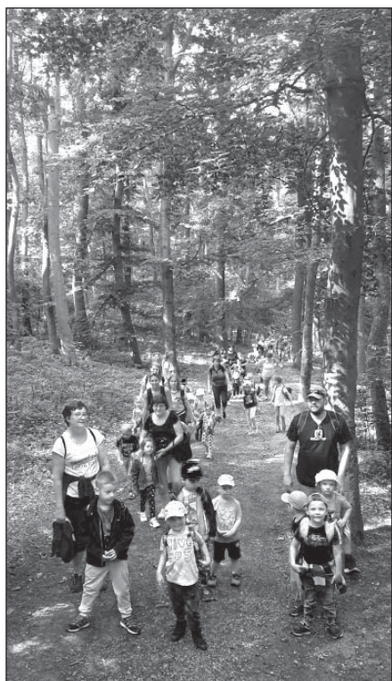
● Prijemná bola aj cesta lesom

Plánovanie tohtoročného výletu do Smoleníc, veru, nebolo jednoduché. Tak, ako mnoho iných júnových akcií, ho ohrozovali búrky a dážď. Ešte ráno pred výletom sme mali strach, že sa iba povožíme v autobuse, zjeme „šnicle“ a pôjdeme späť do škôlky.