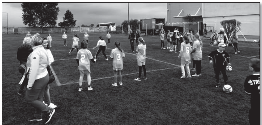
• Zo štvrtého zápasu odohrali trebatické dievčatá len sedem sekúnd...