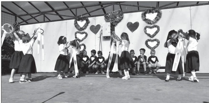
● Počas tanca najmenších dievčatiek sa v nejednom oku zaleskla slzička

No a deťom v prvom rade s vyrábaním darčeka a vystupovaním v programe venovanom ich mamičkám. Práve to sa udialo v nedeľu 13. mája 2018 v Areáli zdravia. K pestrému veselému programu prispeli i naši škôlkari. Najskôr tí najmenší a po nich ostrieľaní „takmer“ školáci. Najčastejšie vyslovovaným slovom bolo – mamička. Pretože starostlivá mama je pre každé dieťa to najdôležitejšie.