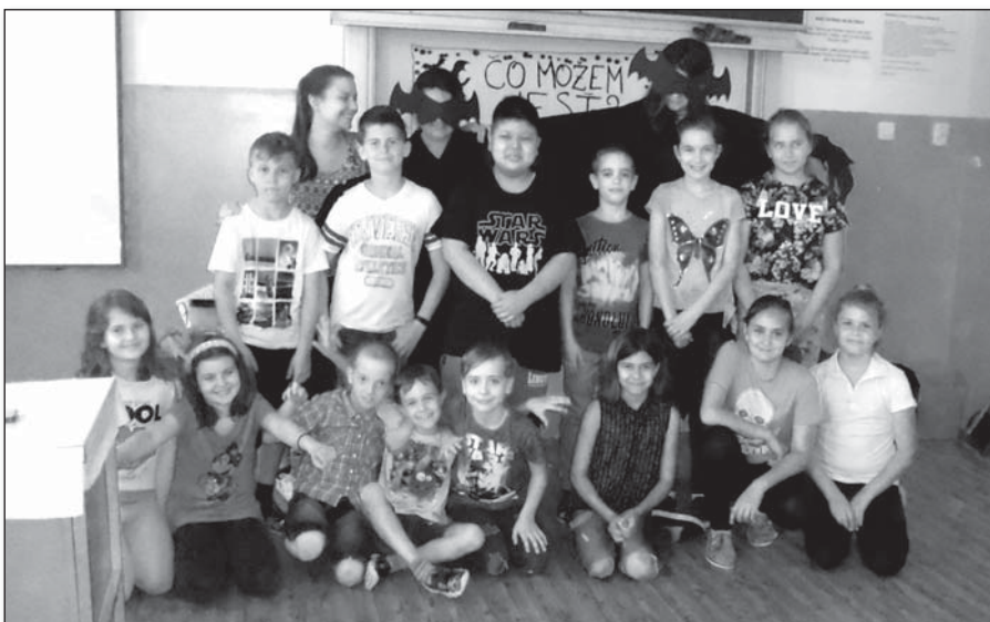
● Ku Dňu Zeme patrila aj prednáška a workshop o netopieroch...