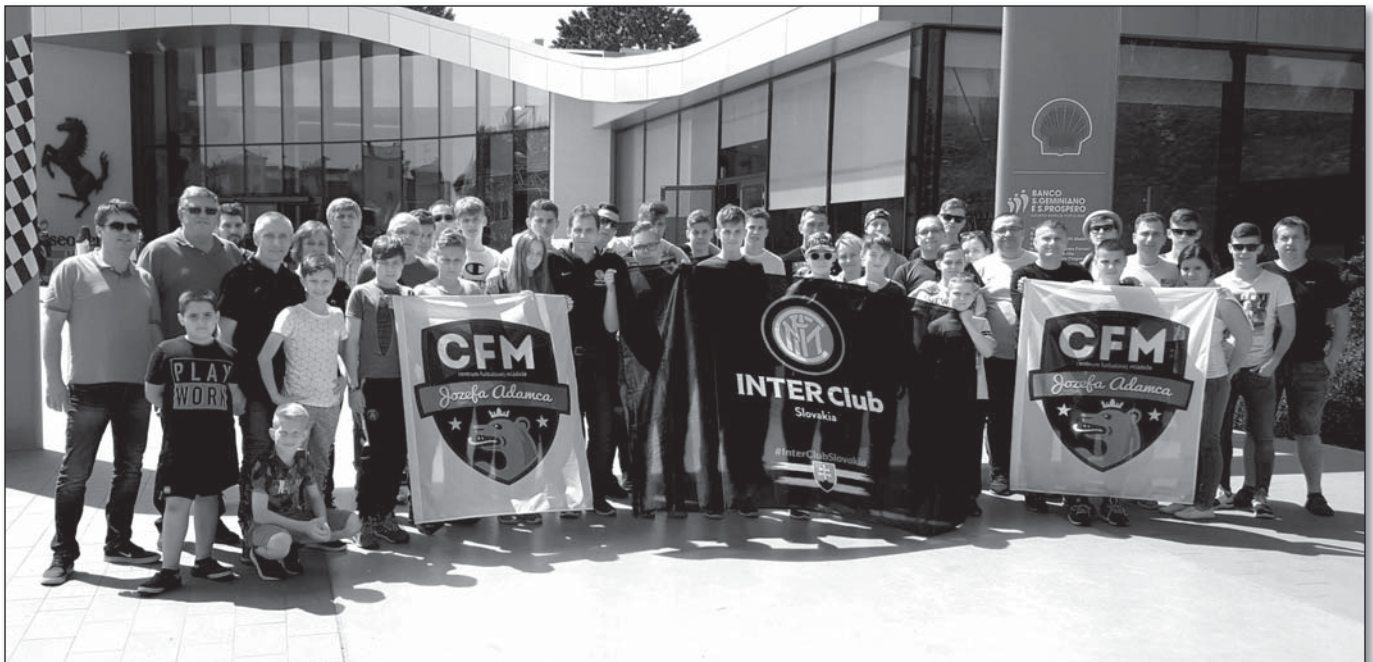
● Pred múzeum Ferrari v Maranello