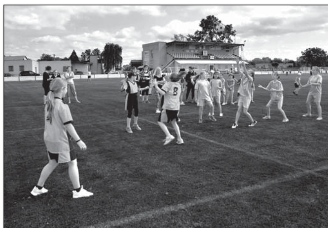
● Druhé miesto vo vybíjanej si vybojovali domáce hráčky