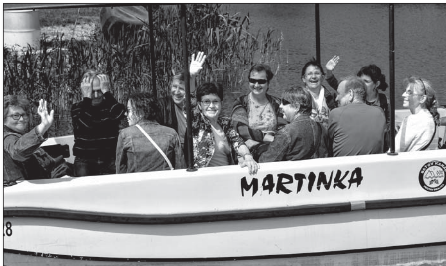
● Po Baťovom kanáli sa účastníci výletu previezli na lodiach Martinka a Glória