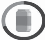
PLECHOVKA 20 - 100 ROKOV