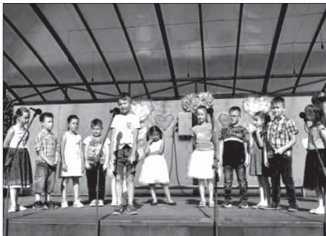
• Tanec prvákov na Deň matiek