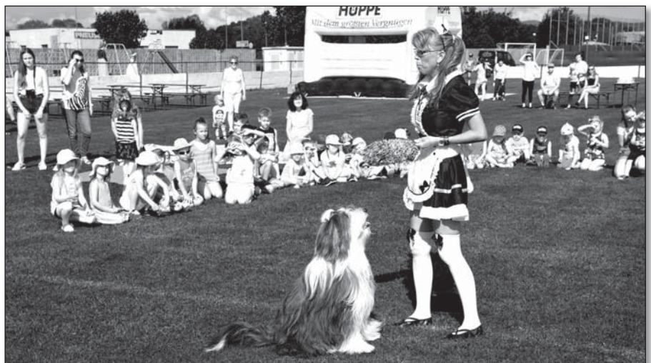
● Veselý psík si získal všetky deti