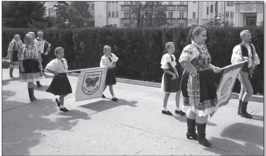
● Otvorenie kúpeľnej sezóny v Piešťanoch 2018 – deti FS Kapustárik spolu s členmi FS Krakovienka

Dňa 1.6.2018 sme mali v škole Deň detí. Pani učiteľky nám pripravili super program. Každá si vybrala nejakú rozprávku.