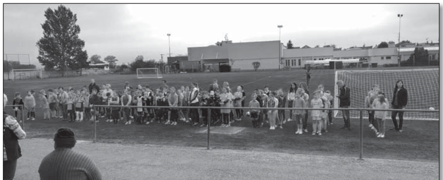
• Na štadión v Ostrove neplánovane prišiel aj dážď

Dňa 17.5.2018 sme sa zúčastnili na športovej súťaži škôl z Mikroregiónu nad Holeškou v minifutbale a vo vybíjanej. Tento rok sa MicroCUP konal na štadióne v Ostrove.