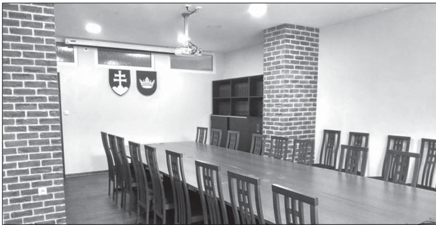
● Aj zasadačka obecného úradu dostala novú tvár

V prípade zvýšenia príjmovej časti rozpočtu obce, resp. získania dotácií, môžu byť počas roka zaradené do realizácie i iné investičné záležitosti, ktoré boli v materiáli na júnové rokovanie obecného zastupiteľstva označené termínom – nezáväzná investičná akcia. - Ocú -