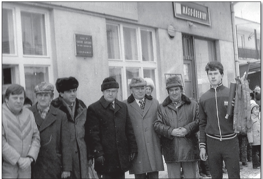
● Spartakiádu štafetu vítali predstavitelia obce