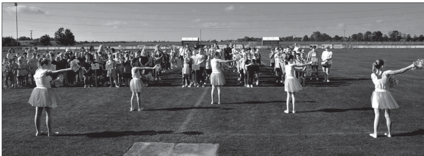
● Oficiálne otvorenie olympiády obohatili trebatické štvrtáčky tanečným vystúpením

Už XX. ročník Olympiády nepnoorganizovaných škôl Piešťanského okresu v areáli Futbalového štadióna Trebatice sa konal dňa 22.5.2018. Súťaž organizovala Obec Trebatice v spolupráci so ZŠ Trebatice. Olympiáda má putovný charakter, každý rok sa organizuje v inej obci, hosťiteľom je iná základná škola.