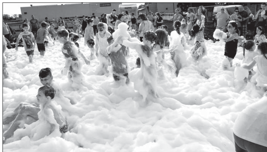
● Nadšenie v hasičskej peně

zahučali motory parádnych motoriek a nielen malí, ale i veľkí s obdivom pozorovali ich jazdu. Ochotní muži v čiernom koženom oblečení obetavo vozili chlapcov i dievčatá na dvojkoľosových tátošoch. Lenže ešte ani neskončili a okolím sa rozozneli húkačky hasičského auta. To už prišli pobeďimskí hasiči, aby deťom najskôr ukázali, čo sa skrýva vo vnútri ich auta a hlavne, aby na plochu tréningového ihriska nastriekali bielu penu. Nuž a vtedy už radosť naozaj nemala konca. Vyskákali sa v nej škôlkari, školáci i dospelí, mnohí po prvýkrát v živote vyskúšali pocit ponorenia sa do hustej bielej „šľahačky“.