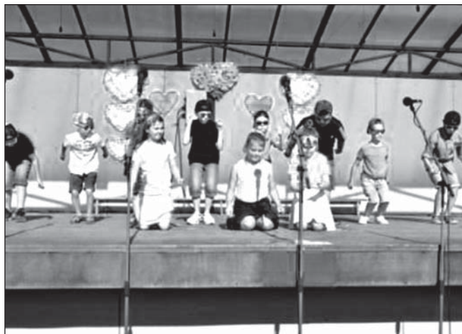
• Tretiaci a ich moderný tanec

V nedeľu 13.5.2018 oslavovali naše mamičky svoj sviatok – Deň matiek. Mali sme sa stretnúť v Areáli zdravia o tretej hodine poobede. Kto chodí do folklórneho súboru Kapustárik, mal prísť do areálu o pol druhej. Ešte raz sme si to všetko zopakovali aj so živou kapelou, ktorá sa volá Karpatská muzika.