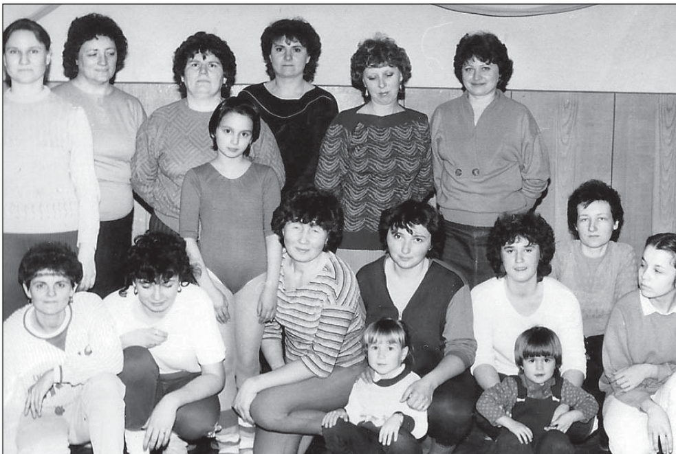
● O cvičenie mali ženy veľký záujem