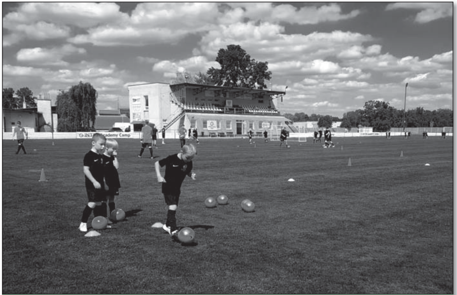
● V tohtoročnom kempe malo veľké hráčske zastúpenie i CFM JA