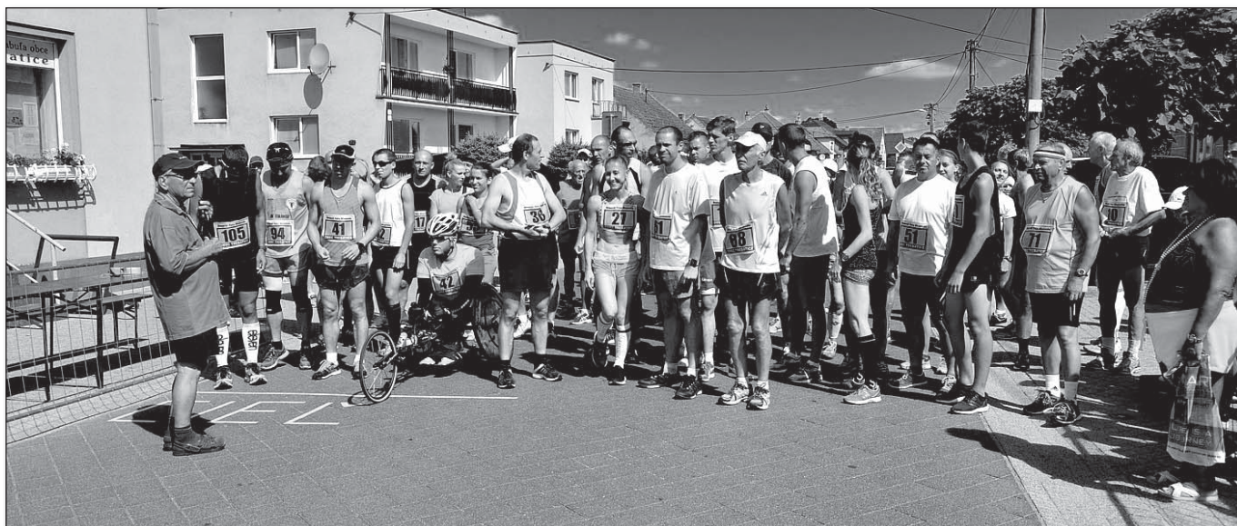
• Krátko pred štartom v roku 2015