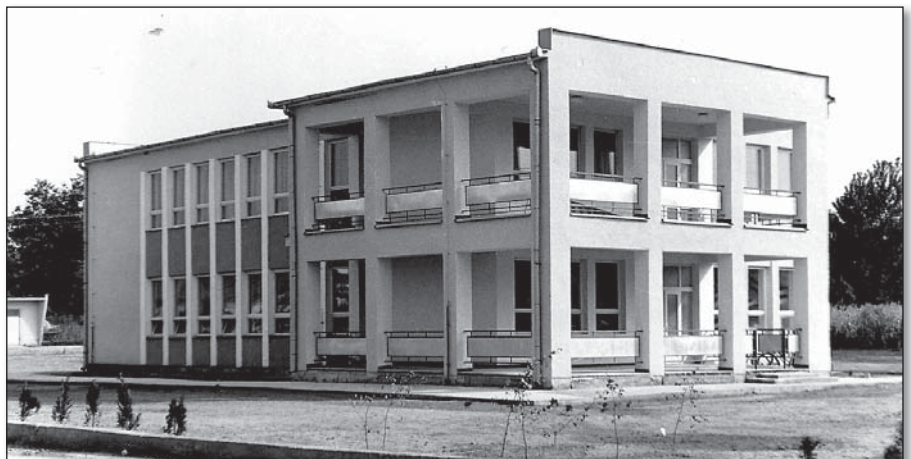
● Novootvorená budova materskej školy