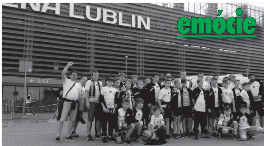
● Z Lublinu sme si odnášali tie najkrajšie futbalové zážitky