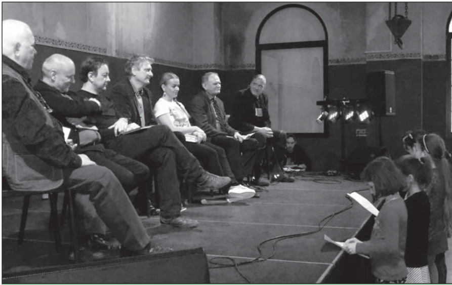
• Beseda so šiestimi spisovateľmi sa uskutočnila v Starej elektrárni v Piešťanoch