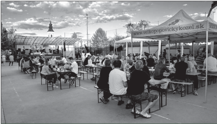
• Areál zdravia ponúkol hudbu, príjemné letné posedenie a poľovnícky guláš