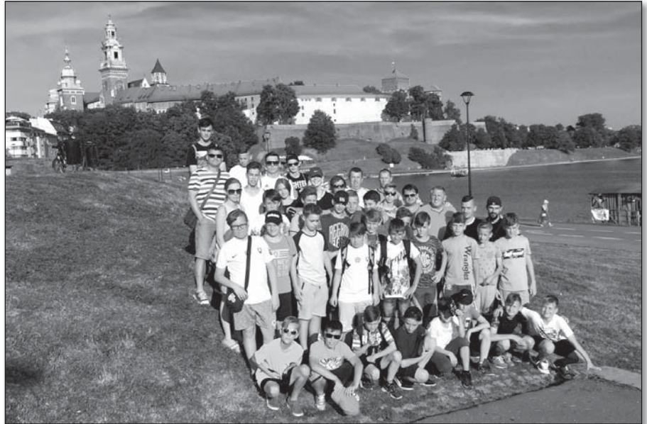
● Prehliadka Krakova s majestátnou riekou Visla zanechala u chlapcov z CFM JA takisto krásne spomienky

Po prvýkrát v našej krátkej histórii centrum a jeho predstavitelia prijali novú výzvu posúvať hranice našej aktivity o niečo ďalej. Preto sme pretavili víziu spoločného futbalového zájazdu do konkrétnej realizácie. V termíne od 19.6.2017 do 23.6.2017 sme počas prestávky absolvovali päťdňový zájazd do Poľ-