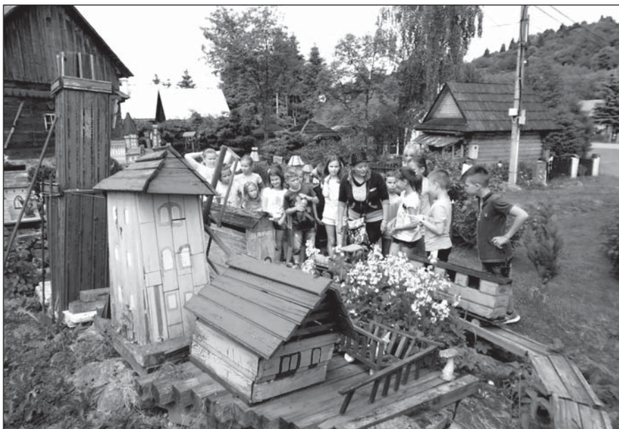
• Týždeň v rozprávkovej krajine Tramptária

Ubytovaní sme boli v penzióne Stred Európy spolu s ďalšími školami. Viac ako 200 detí so svojimi pani učiteľkami sa tak na päť dní ocitlo v rozprávkovej krajine Tramptária, kde ich čakal kráľ s kráľovnou a dvornými dámami, ktorí im pripravili program ako z rozprávky. Doobeda sme sa venovali kráľovským remeslám ako napr. maľovanie, šperkárstvo, tanec, divadlo, lukostreľba, jazda na koni či šport.