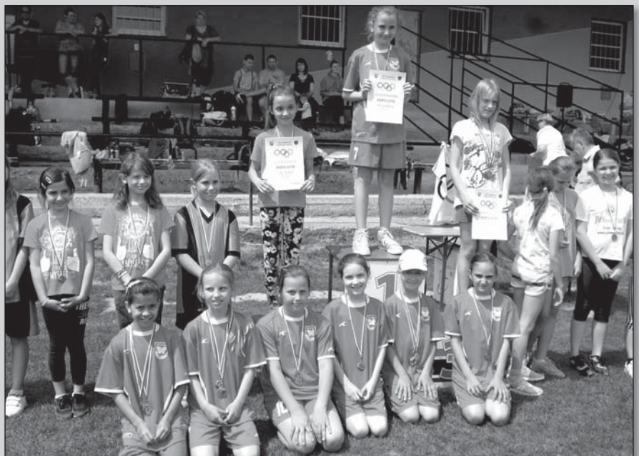
• Súťaž vo vybíjanej v Krakovanoch opäť vyhrali naše dievčatá

Štyri málotriedky už zanikli (Prašník, Šterusy, Ratnovce, Borovce), takže súťažili žiaci 1. – 4. ročníka z Krakovian, Ostrova, V. Orvišťa, D. Lopašova, Veselého, Dubovian a Trebatíc. Krásne počasie nám prišlo, chceli sme totiž dokázať, že sme výborní športovci. Autobus nás odviezol do Krakovian na futbalové ihrisko. Súťažilo sa v dvoch kategóriách: 1. kategória – 1. a 2. ročník a 2. kategória – 3. a 4. ročník. Mali sme pripravené súťaže: beh na 60 m, 500 m, futbal, vybíjanú, hod kriketovou loptičkou a preťahovanie lanom. Celkovo zo všetkých zúčastnených škôl sme sa umiestnili na 3. mieste a získali sme krásny pohár!