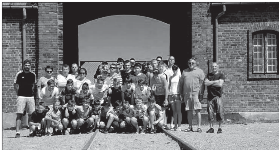
● Prehliadka koncentračného tábora Osvienčim bola desivým svedectvom temnej vojnovnej minulosti