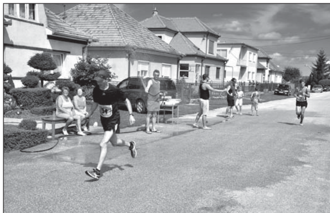
● Občerstvovačky v Trebaticiach počas pretekov si bežci vždy pochvalujú