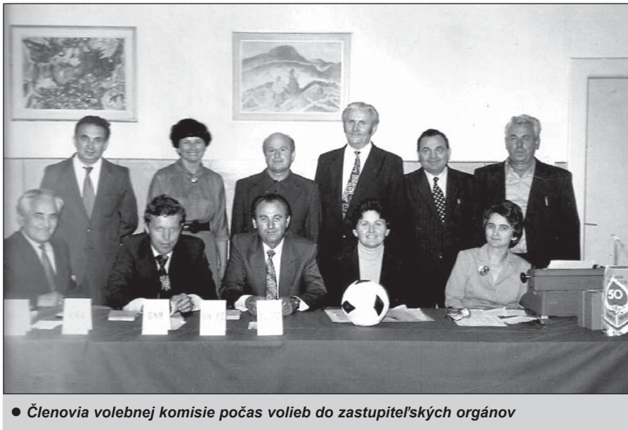
• Členovia volebnej komisie počas volieb do zastupiteľských orgánov

Červený kríž – mal až 103 členov. Predsed-