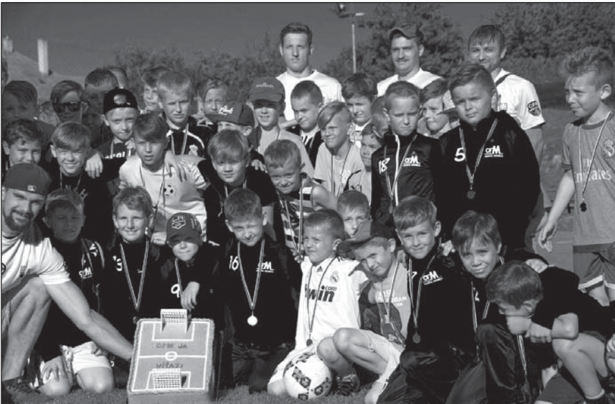
● Prípravkari z CFM JA so sladkou odmenou a medailami po vyhodnotení jarnej časti súťaže.