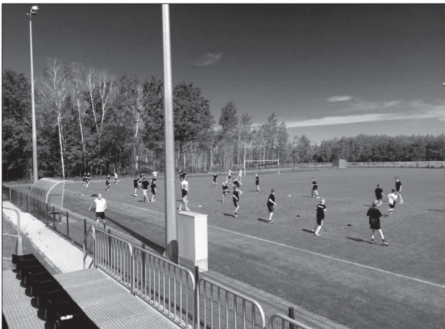
• Pred zápasom s mládežníkmi z Mielca