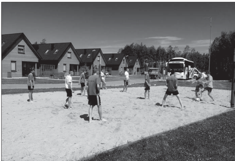
● Nohejbal na rozpálenom piesku padol chlapcom vhod